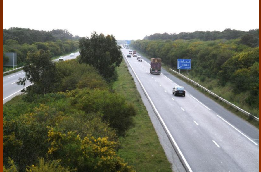
Автодорога А3 Касабланка — Рабат в Марокко