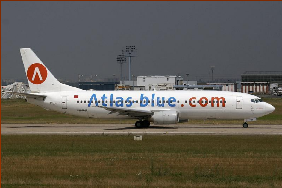
Boeing 737—400 компании Голубой Атлас