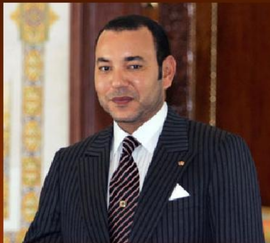
Король Мухаммед VI