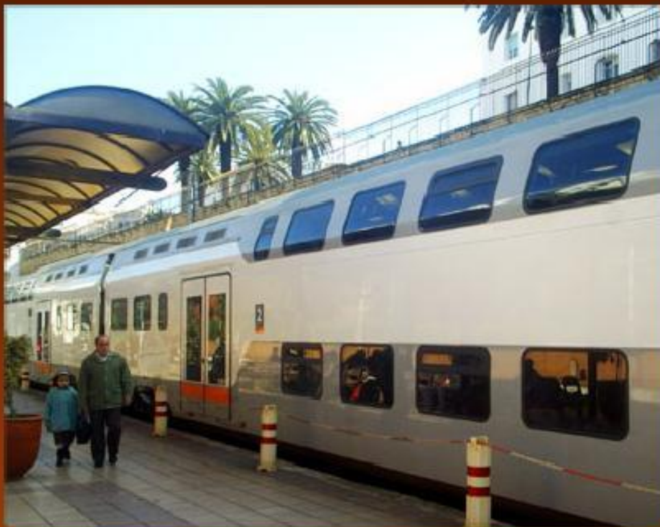
Двухэтажный вагон поезда на одной из станций в Марокко