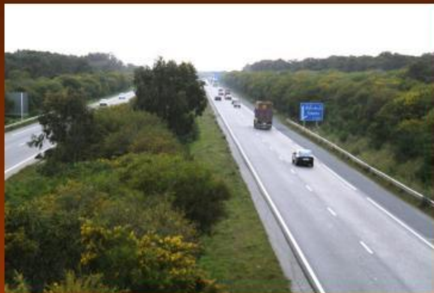
Автодорога А3 Касабланка — Рабат в Марокко