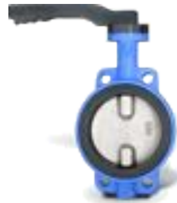
Дисковые поворотные затворы