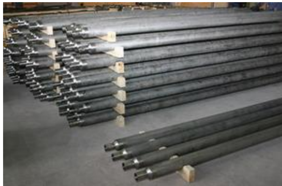
Ампулы для хранения ядерного топлива