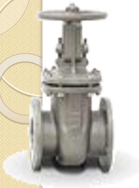
Задвижки стальные литые клиновые