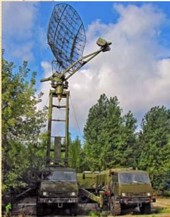
Станция для контроля воздушного пространства