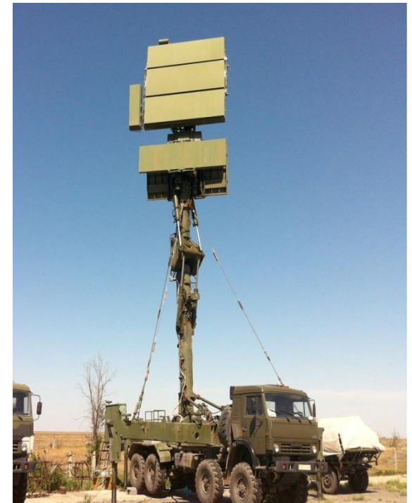
Станция для обнаружения и сопровождения воздушных объектов