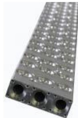
Комплектующие для ГЦ (Демпфер, коллектор)