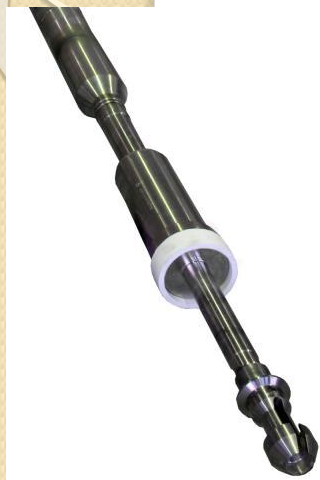
Оборудование для приреакторной зоны (корпус подвески, пробка)