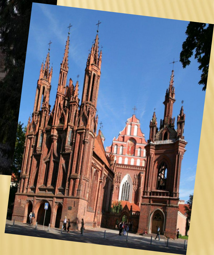
Ұлы Анна храмы