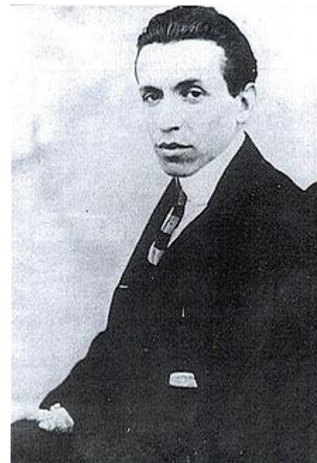
Тибор Самуэли (27.09.1890,— 2.08.1919.) Венгр жұмысшы қозғалысының қайраткері.