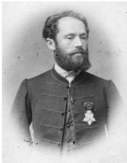
Арминий Вамбери (13.3.1832 — 15.9.1913) — венгр түркітанушысы, этнограф, саяхатшы.