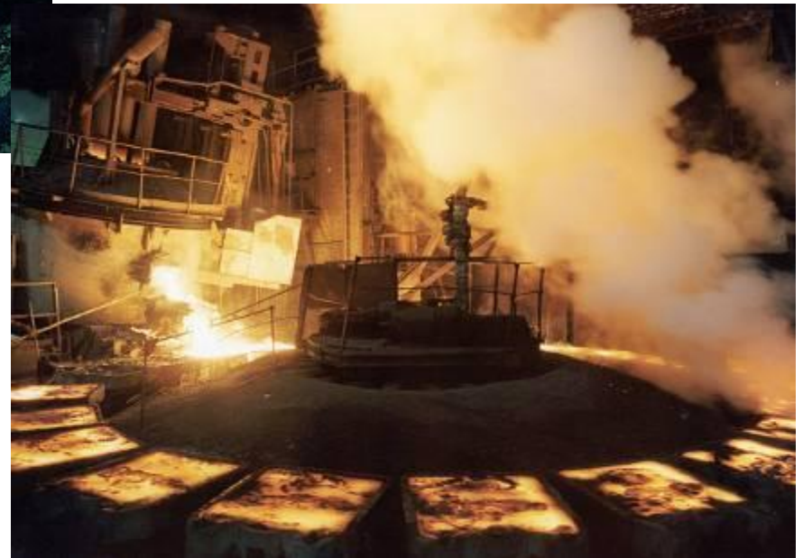
Никелевый завод. Разлив никелевых анодов.