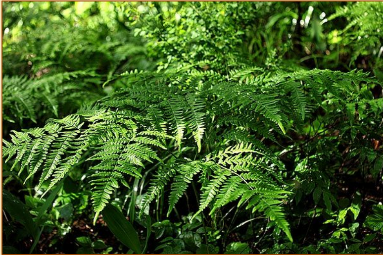
Папоротник Орляк на берегах озер