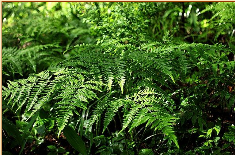
Папоротник Орляк на берегах озер