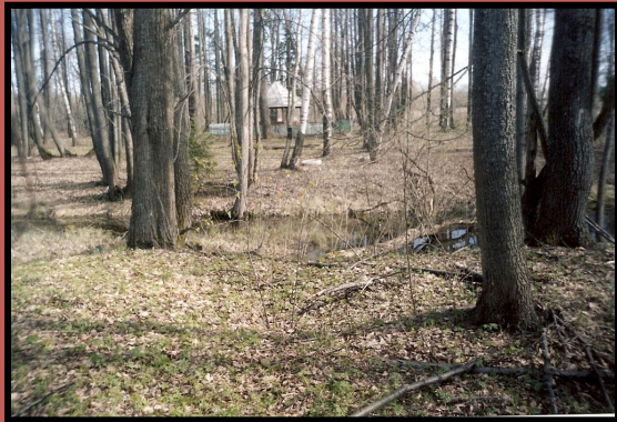
Пруд для отдыха Современное состояние