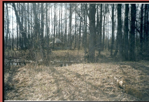
Местечко Ажерово Современный вид