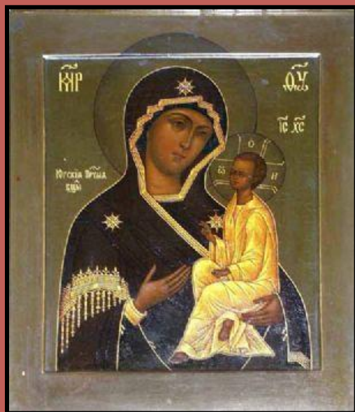
Список Икона Югской Божьей Матери