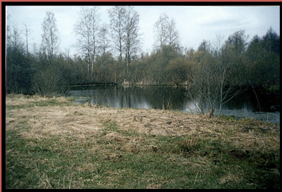
Пруд- купальня Современное состояние

В наши дни здесь о прошлом напоминают лишь два пруда, слева и справа от дороги, да несколько старых развесистых лип. Особенно интересен большой пруд с островом посередине. Остров искусственного происхождения, на нём растут высокие стройные липы. На острове для отдыха сооружена беседка. На него можно попасть по мостику. Пруд этот обмелел, зарос ряской, но не утратил очарования.