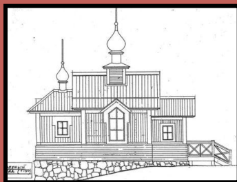
Эскиз Ажеровской домовой церкви