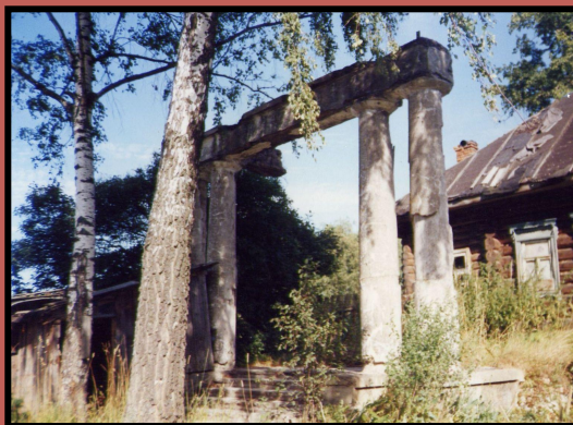
Остатки ворот усадьбы Горшково

В 12 км от Ажерово находилась летняя резиденция Азначеевых Горшково ( Мурзино). Горшково расположено на берегу извилистой речки Ильди, с красивыми весёлыми берегами. От реки шёл пологий откос, по нему направо от дороги огород, оранжерея, за ней уже парадный сад с клумбами и дорожками, ещё правее берёзовая роща, овраг и опять пологий скат, спускавшийся к той же Ильди и на противоположном её берегу опять берёзовая роща ближайших наших соседей – Соковниных.