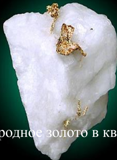
Самородное золото в кварце