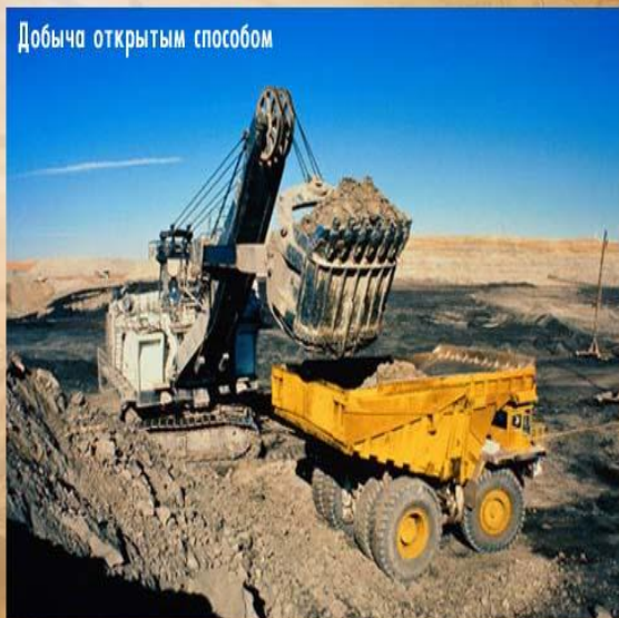
Добыча открытым способом