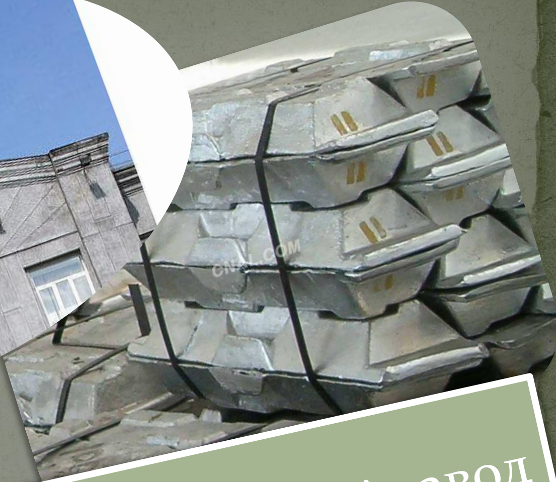
Российский алюминиевый завод