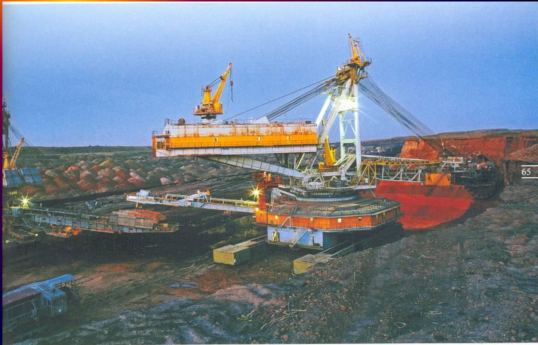
Добыча каменного угля открытым способом