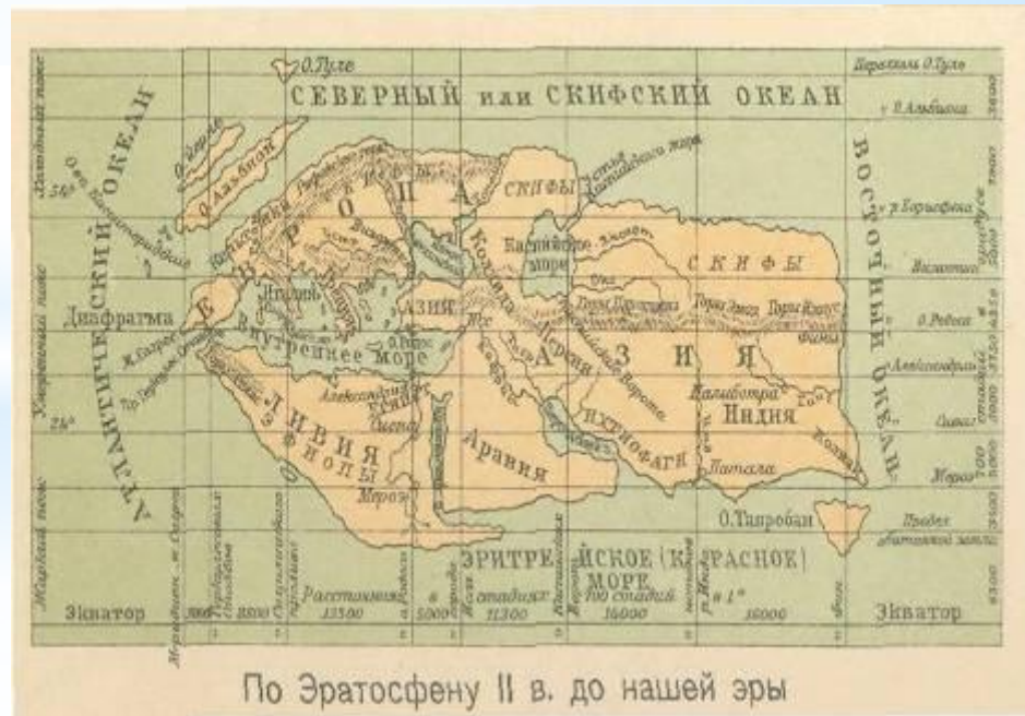
По Эратосфену II в. до нашей эры