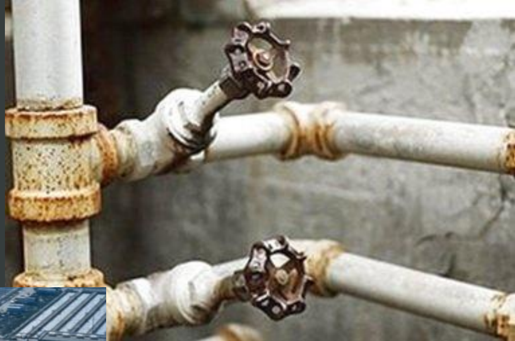
Ухудшение качества воды и водопотери в результате износа коммуникаций