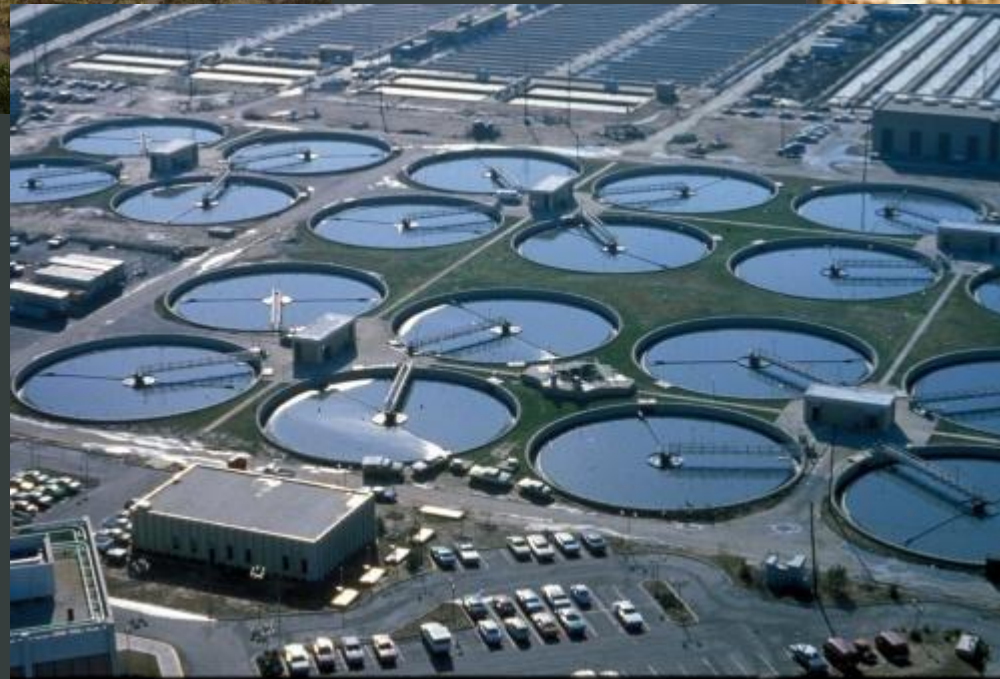
Водоемкие отрасли промышленности и их нерациональное размещение