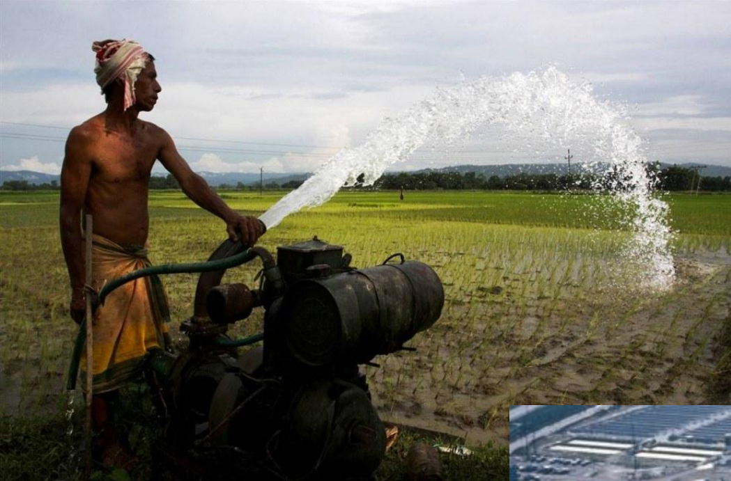
Нерациональное водопользование в с/х