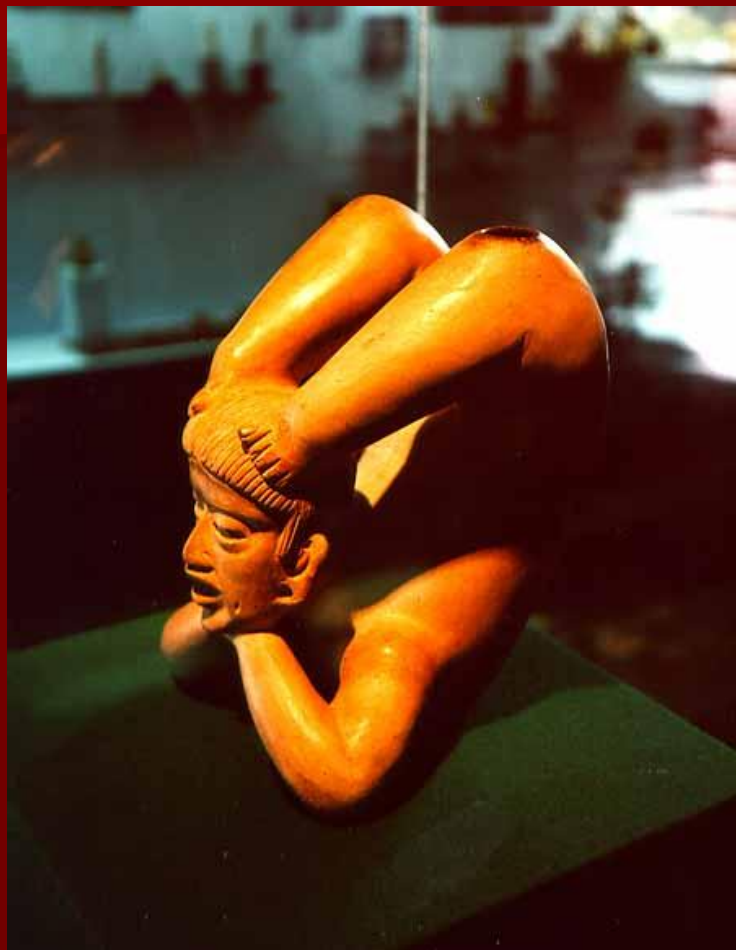
Пустотелая керамическая фигура. Центральная Мексика