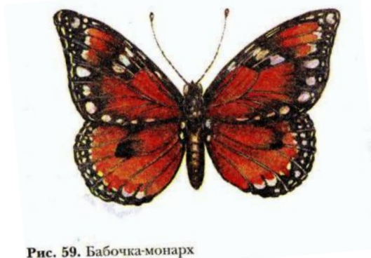
Рис. 59. Бабочка-монарх