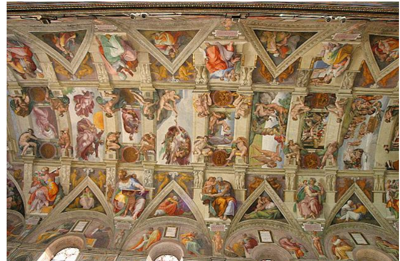
Потолок Сикстинской Капеллы

1512 гг. Микеланджело расписывал свод потолка по заказу Папы Юлия II, а в 1536-1541 гг. расписывал алтарную стену знаменитой фреской «Страшный Суд», по заказу Папы Павла III.