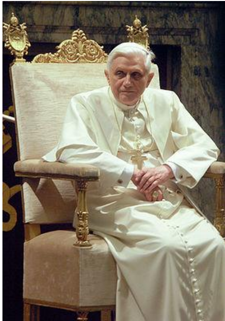
Папа Римский Бенедикт XVI

Ватикан — абсолютная теократическая монархия, управляемая Святым Престолом.