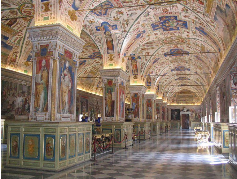
Салон Ватиканской апостольской библиотеки

Ватиканская апостольская библиотека — библиотека, обладающая богатейшим собранием рукописей средневековья и эпох Возрождения. Библиотека, основанная в XV в. Папой Николаем V, постоянно пополняется, и в настоящее время её фонды насчитывают около полутора миллиона печатных книг, 150 000 манускриптов, более 100 000 гравюр и географических карт, 300 00 монет и медалей.