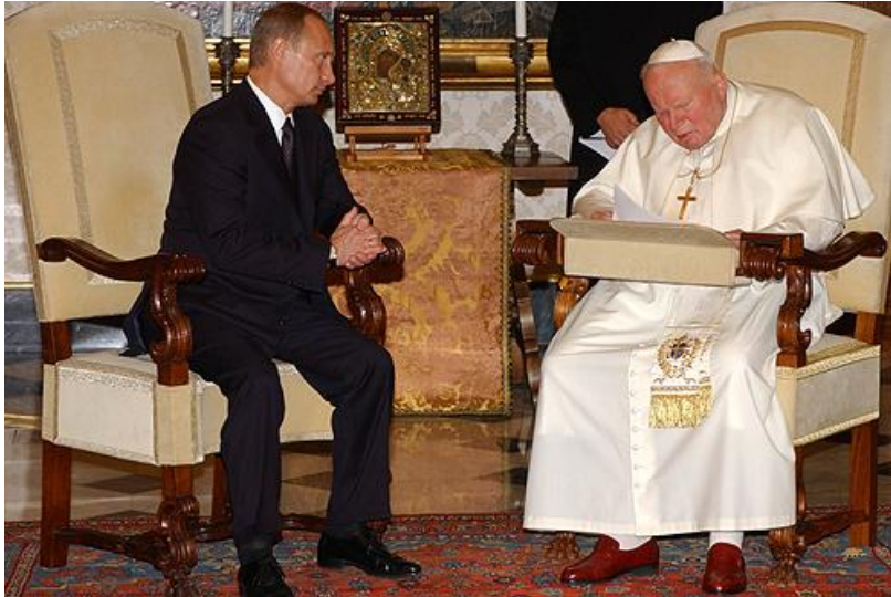
Владимир Путин и Папа Римский Иоанн Павел II (2003 г.)

Святой Престол поддерживает дипломатические отношения со 174 странами мира, в том числе с ЕвроСоюзом и является членом 15 организаций, в том числе ЮНЕСКО и ООН.