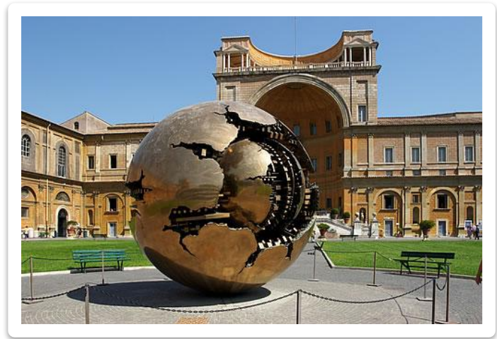
Резиденция Правительства Ватикана

Его главе — Государственному секретарю — предоставлены все полномочия в области светского суверенитета; фактически он исполняет обязанности премьер-министра. Высшие консультативные органы — Вселенский Собор, коллегия кардиналов и епископский синод.