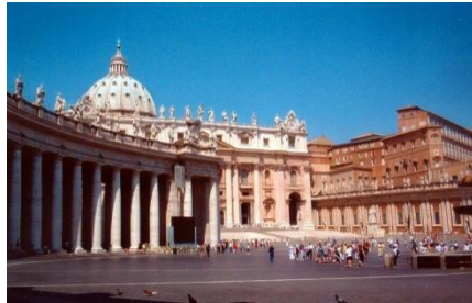
Собор Святого Петра на одноименной площади

В Ватикане расположены всемирно известные шедевры архитектуры — Собор Святого Петра, ватиканские музеи в числе которых знаменитая Сикстинская капелла и др., а также Ватиканская апостольская библиотека. Собор Святого Петра – католический собор, являющийся наиболее крупным сооружением Ватикана и до последнего времени считавшийся самой большой христианской церковью в мире. Одна из четырёх патриарших базилик Рима и церемониальный центр Римско-католической церкви.