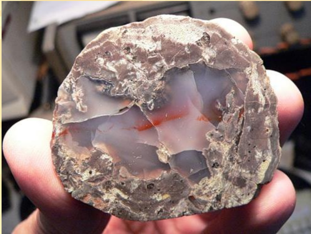
Половинка халцедоновой секреции

Секреции – минеральное вещество, заполнившее какую-либо пустоту в горной породе и обладающее концентрическим строением.