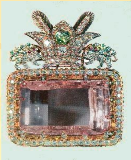
Обработанный алмаз - бриллиант

Свойства минералов определяются их внутренней структурой и химическим составом. Внутренняя структура минералов – это их кристаллическая структура, т.е. кристаллическая решётка и разные расстояния между элементарными частицами в узлах решётки.