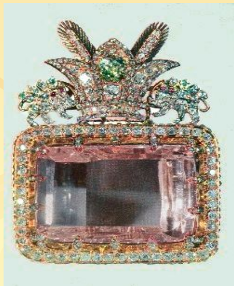
Обработанный алмаз - бриллиант

Свойства минералов определяются их внутренней структурой и химическим составом. Внутренняя структура минералов – это их кристаллическая структура, т.е. кристаллическая решётка и разные расстояния между элементарными частицами в узлах решётки.