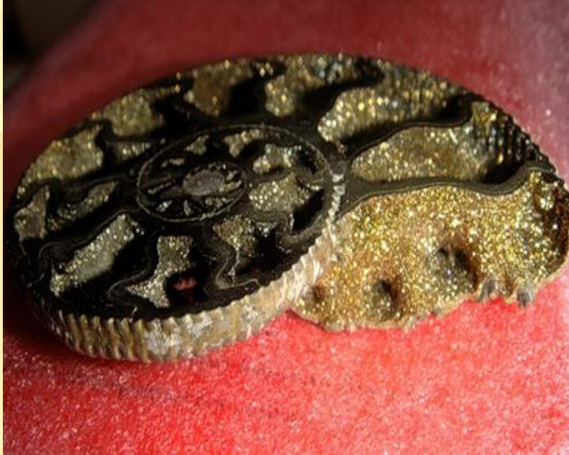
Псевдоморфоза пирита по аммониту