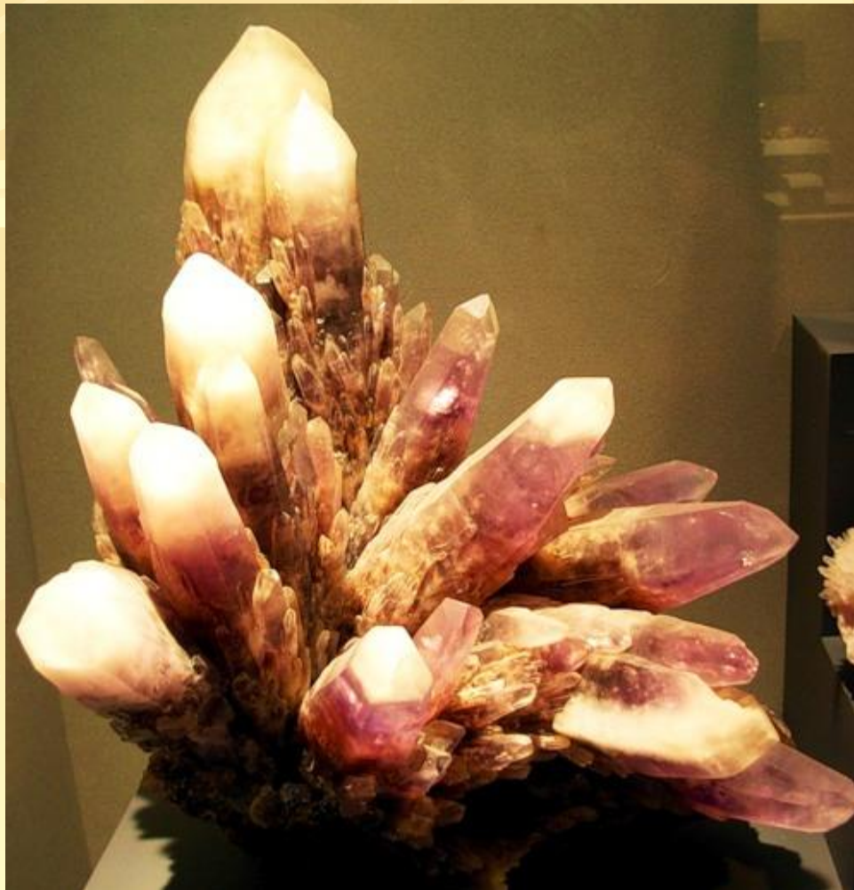
Друза аметистовидного кварца

Друзы-группы кристаллов, приросших к стенкам пустот или трещин.