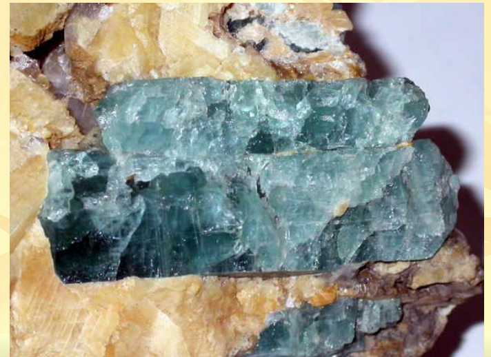
Апатит в кальците