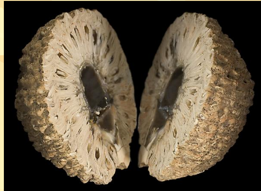
Замещенные халцедоном шишки араукарии юрского периода