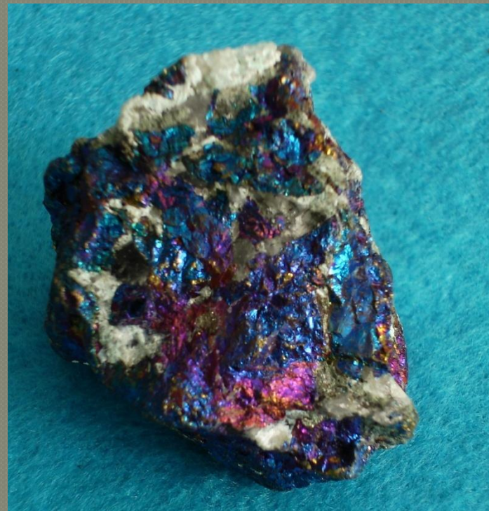
Минеральный агрегат, образованный белым кварцем и борнитом

Части, что входят в состав минеральных агрегатов называются минеральными индивидами. Они представляют собой отдельные кристаллы и зерна, отделенные друг от друга и представляют собой форму нахождения минеральных видов в природе. Когда минеральные индивиды одного и того же или разных минералов срастаются, они образуют минеральный