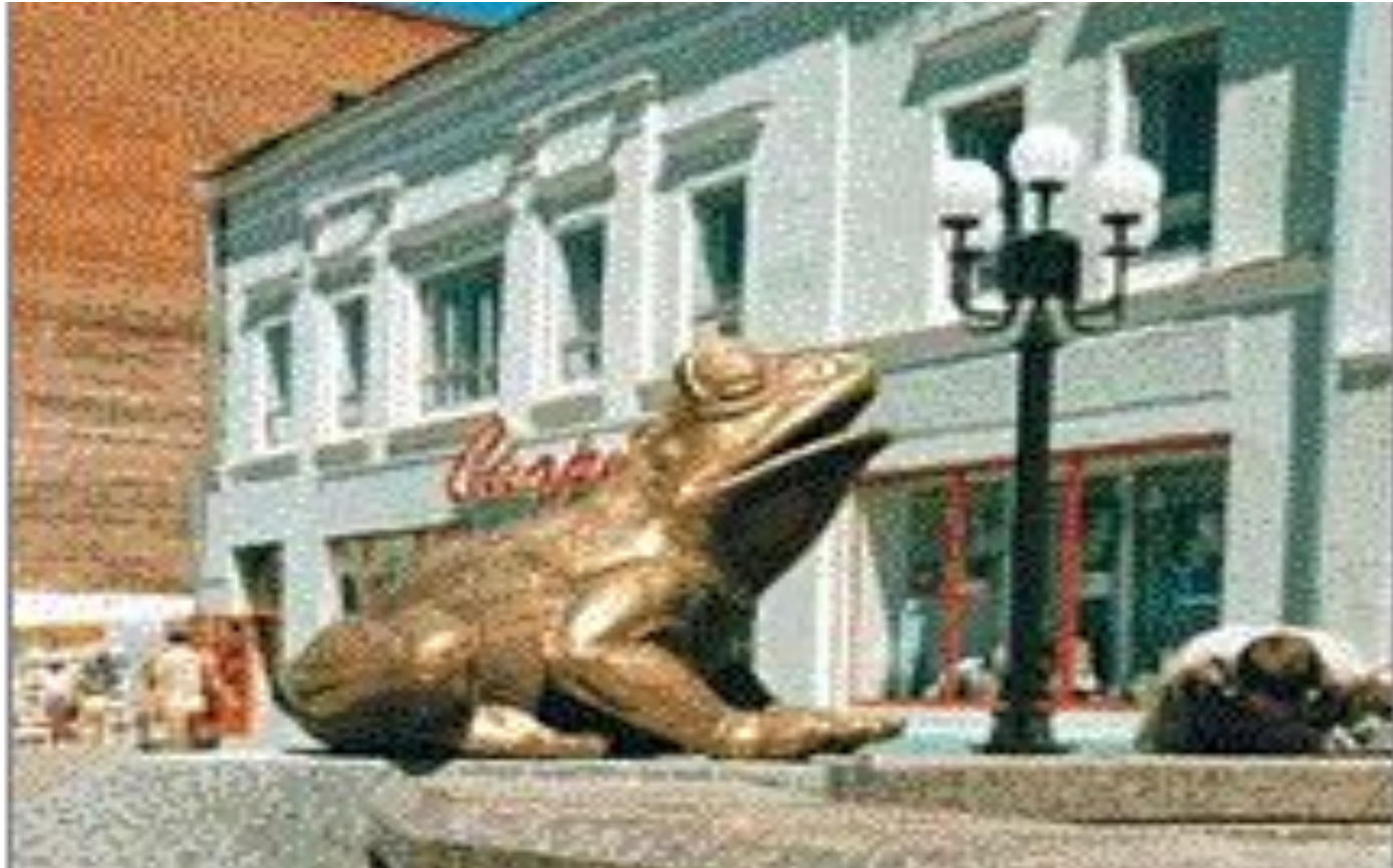
Городской фонтан в г. Казань - памятник лягушке