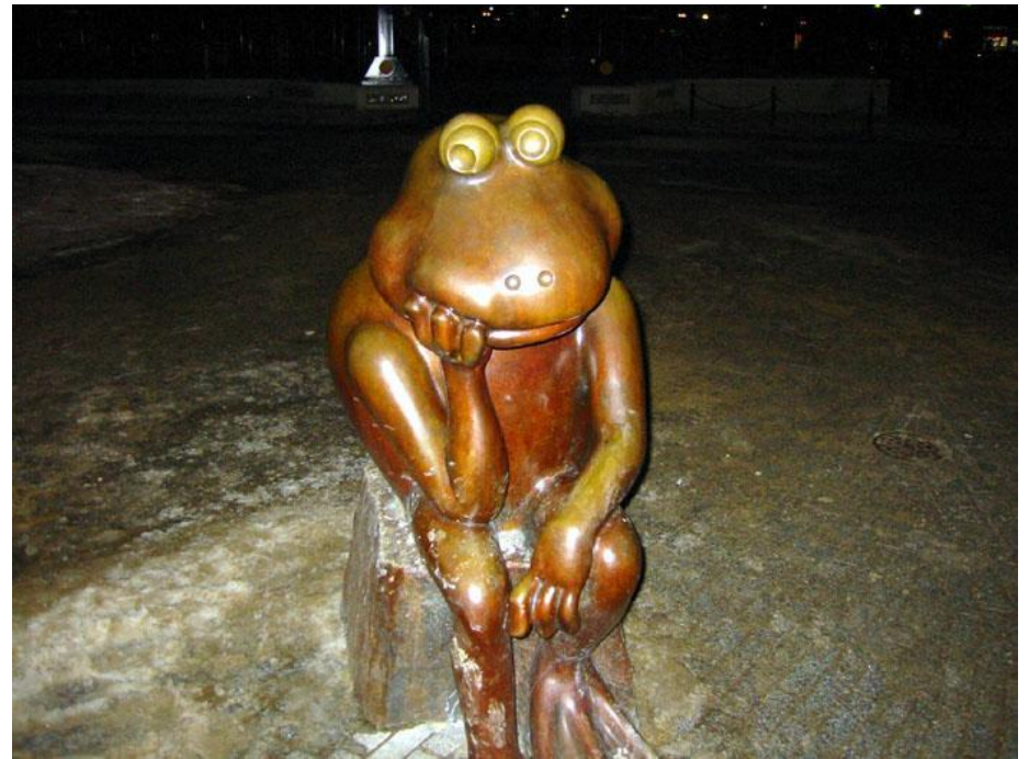
Памятник лягушке в Бостоне.