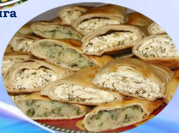
Плацинда с капустой