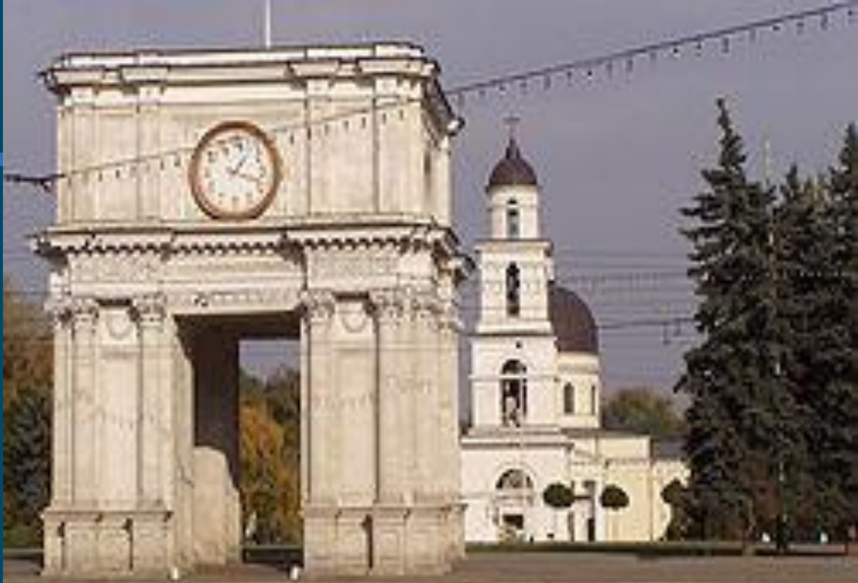
Триумфальная арка и православный кафедральный собор в центре Кишинёва