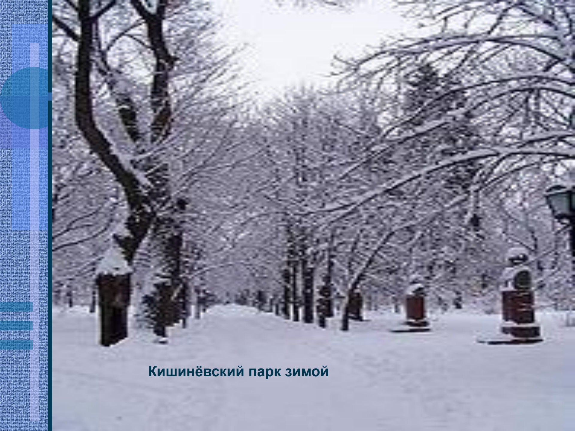
Кишинёвский парк зимой