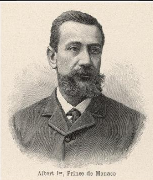
Альберт Шарль Ополе Гримальди