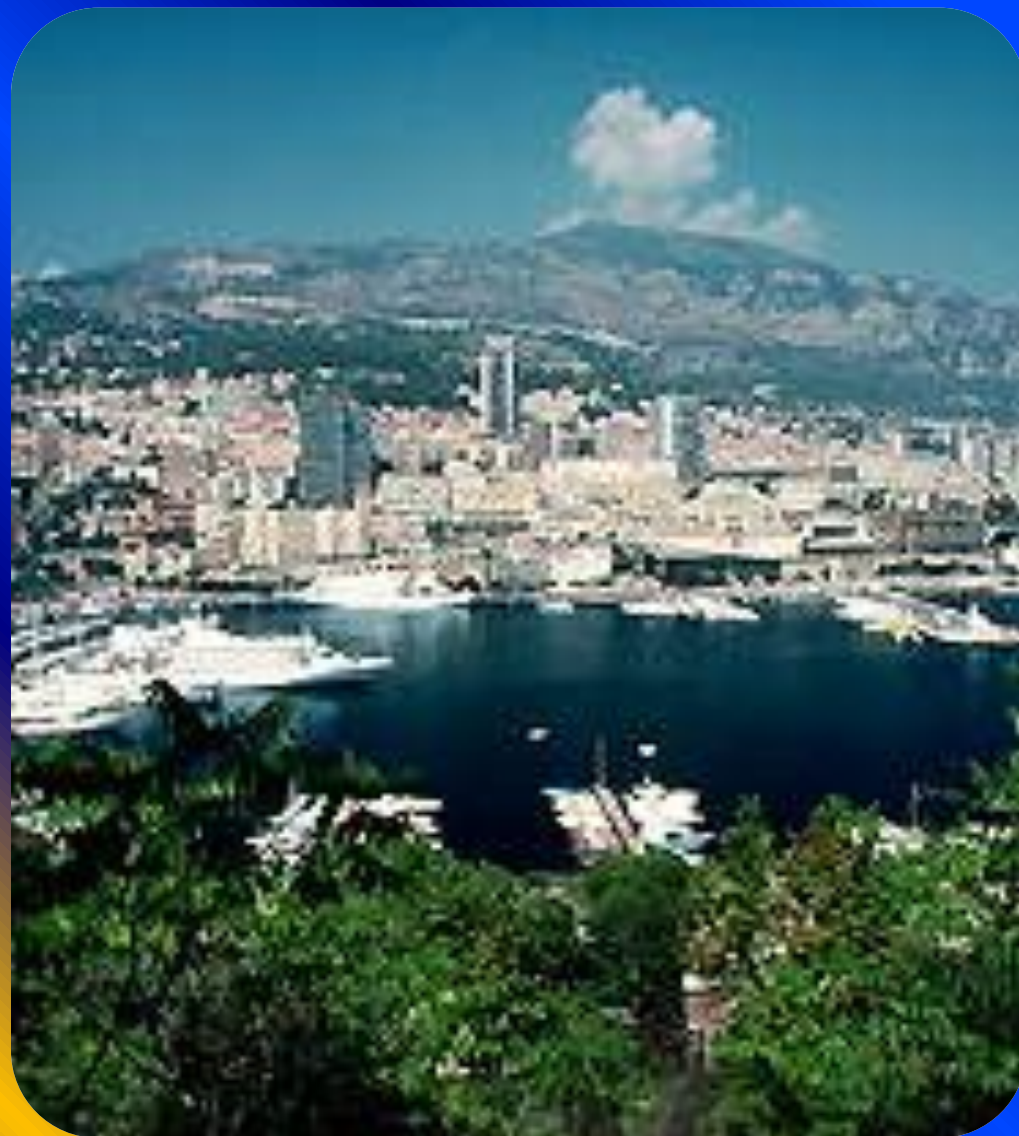
Монако. Панорама города. Вид на порт.