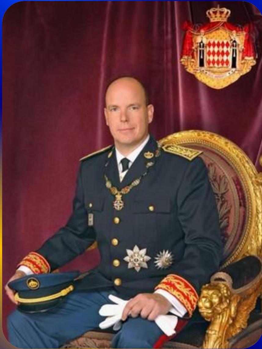
Принц Монако Алберт 2