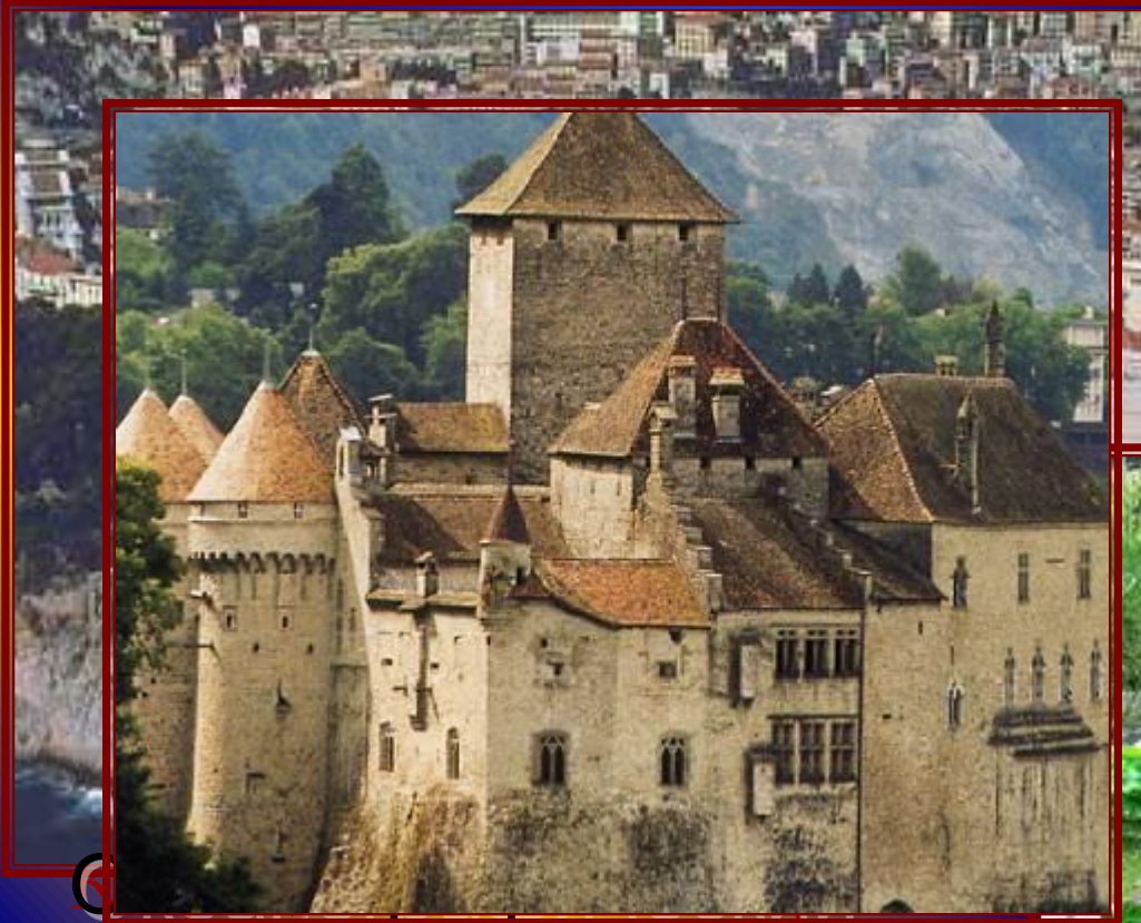
Музей Крепость Форт Антуан