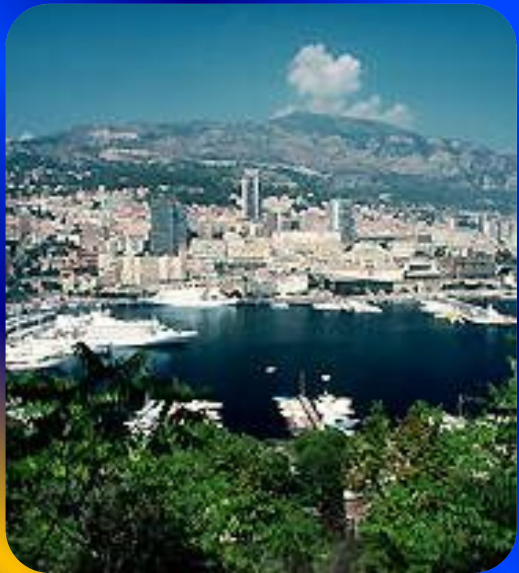
Монако. Панорама города. Вид на порт.