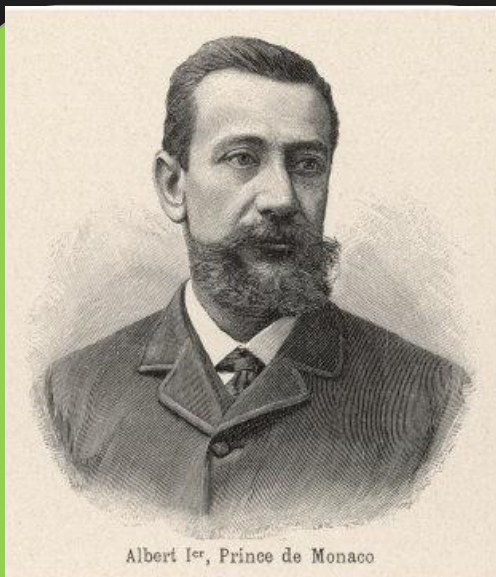
Альберт Шарль Ополе Гримальди