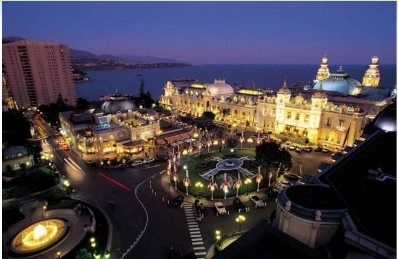
Monte Carlo Casino