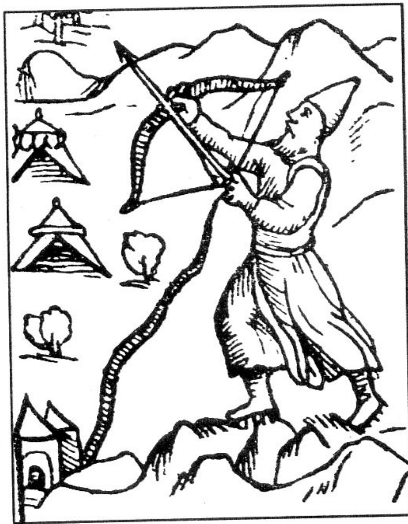
ОХОТНИК. С карты Олая Магнуса 1539 года