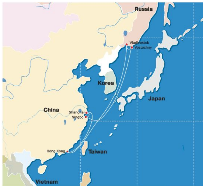
FCDL - FESCO China Direct Service

СРЕДИ КОНТЕЙНЕРНЫХ ЛИНИЙ, ОПОЯСЫВАЮЩИХ ВЕСЬ ЗЕМНОЙ ШАР, УЖЕ ЕСТЬ И РЕГУЛЯРНЫЕ КРУГОСВЕТНЫЕ ЛИНИИ. НЕКОТОРЫЕ ИЗ ОКЕАНСКИХ КОНТЕЙНЕРНЫХ ЛИНИЙ В КАЧЕСТВЕ СОСТАВНОЙ ЧАСТИ ВХОДЯТ В ТАК НАЗЫВАЕМЫЕ ТРАНСПОРТНЫЕ «МОСТЫ» МЕЖДУ ЯПОНИЕЙ И ЗАПАДНОЙ ЕВРОПОЙ, ЯПОНИЕЙ И ВОСТОЧНЫМ ПОБЕРЕЖЬЕМ США, НА КОТОРЫХ ПЕРЕВОЗКИ СУХОПУТНЫМ ТРАНСПОРТОМ ЧЕРЕЗ ТЕРРИТОРИИ СНГ И США СОЧЕТАЮТСЯ С МОРСКИМИ ПЕРЕВОЗКАМИ ЧЕРЕЗ АТЛАНТИЧЕСКИЙ, ТИХИЙ ОКЕАНЫ И ЯПОНСКОЕ МОРЕ.