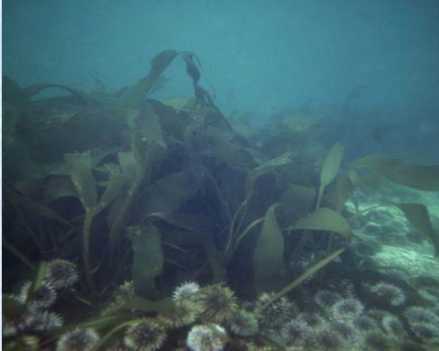
Ламинарии с поселениями морских ежей (Баренцево море).