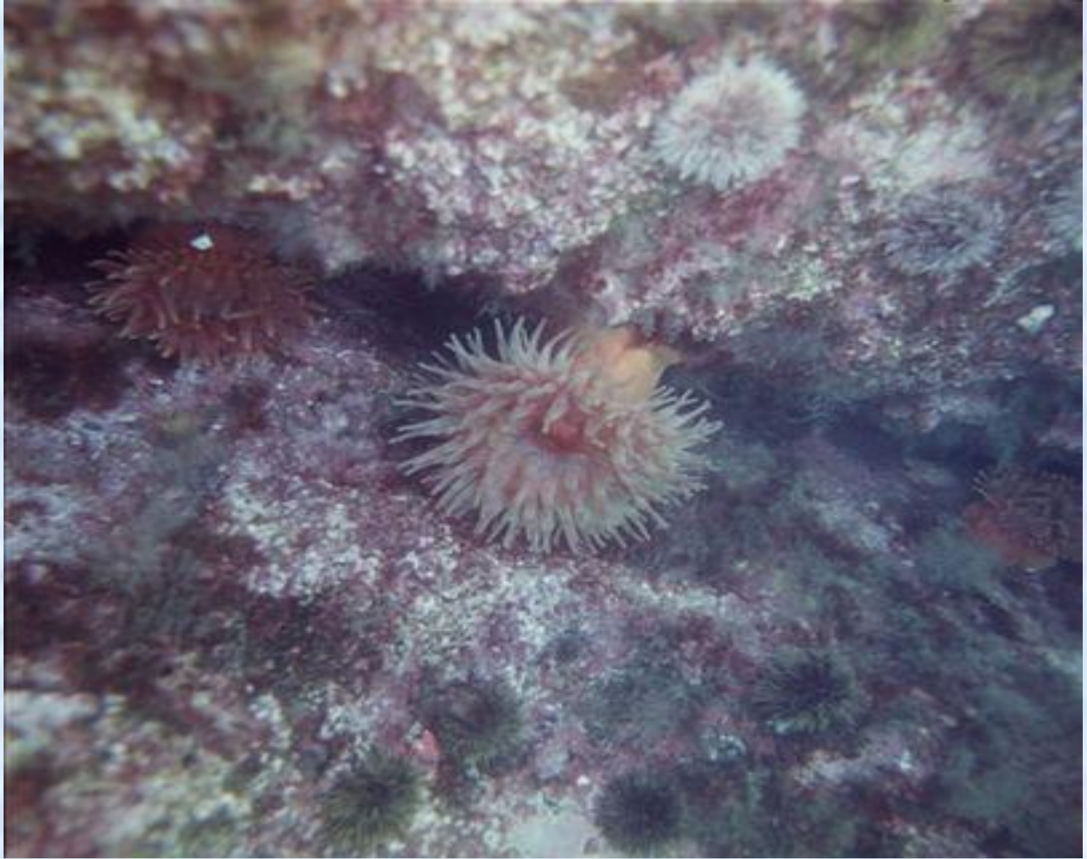
Зелёные и багряные водоросли