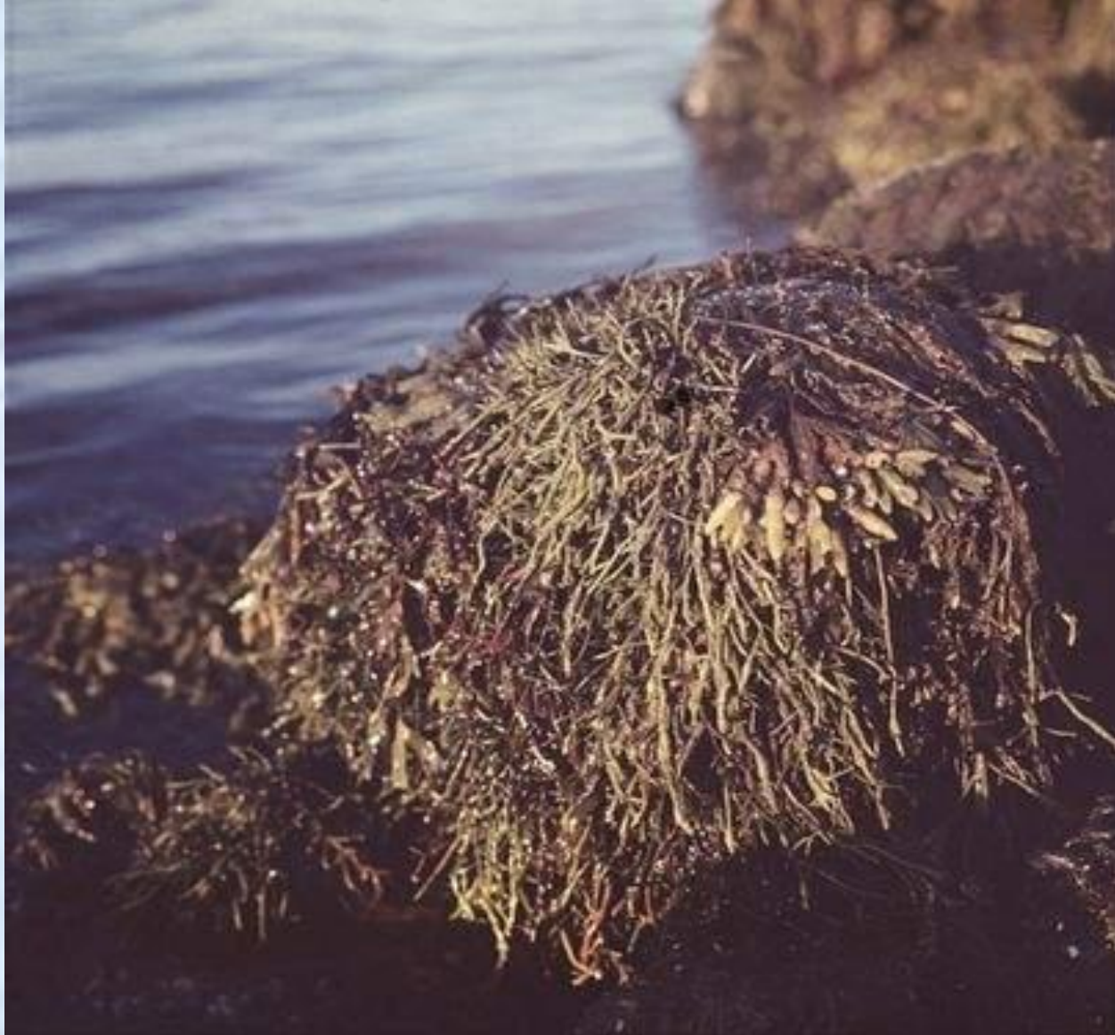
Аскофиллум и фукус на валуне в Баренцевом море.