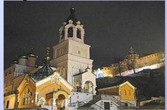
Церковь Рождества Иоанна Предтечи

Благовещенский монастырь был основан в XIII веке, вскоре после основания Нижнего Новгорода.