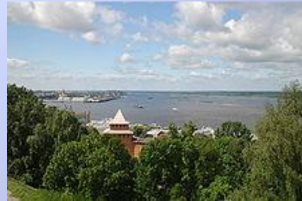
Вид на слияние рек Оки и Волги

Расположен в центре Восточно-Европейской равнины у слияния Оки с Волгой. Ока делит город на две части — верхнюю на Дятловых горах и нижнюю на её левом низинном берегу. В период с 1932 по 1990 год город носил название Горький (в честь писателя Максима Горького).