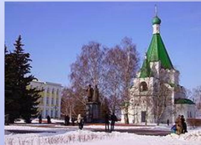
Памятник князю Юрию Всеволодовичу и епископу Симону Суздальскому у Архангельского собора в Кремле

Нижний Новгород — пятый по численности населения город России с населением 1 278 803 человек, важный экономический, транспортный и культурный центр страны. По национальному составу преобладают русские. В Нижнем Новгороде проживают также представители других национальностей — татары, украинцы, чувашаи, мордва, армяне, азербайджанцы, белорусы, грузины, евреи, марийцы, цыгане. Жители Нижнего Новгорода называются "нижегородцы".