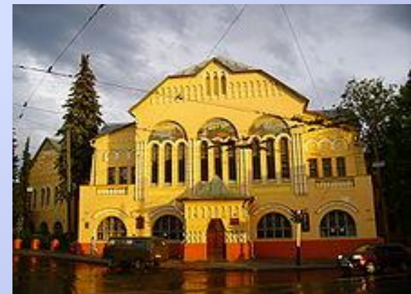
Дворец Детского творчества им. Чкалова