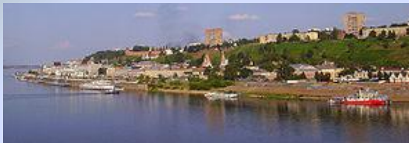
Вид на центр города с Канавинского моста