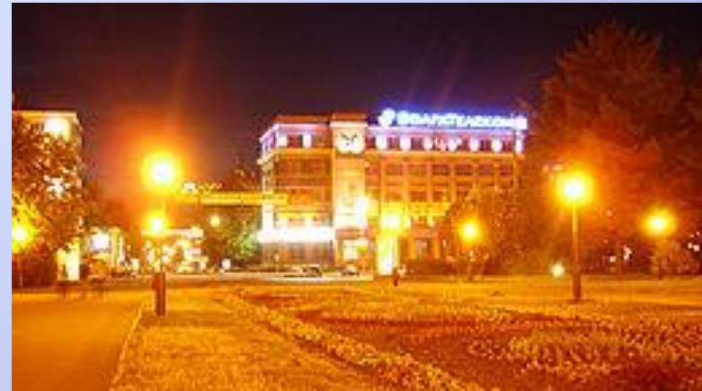
Дом Связи на пл. Горького