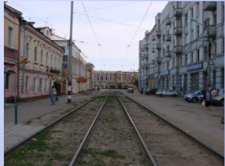
Канавинский район. Улица Канавинская