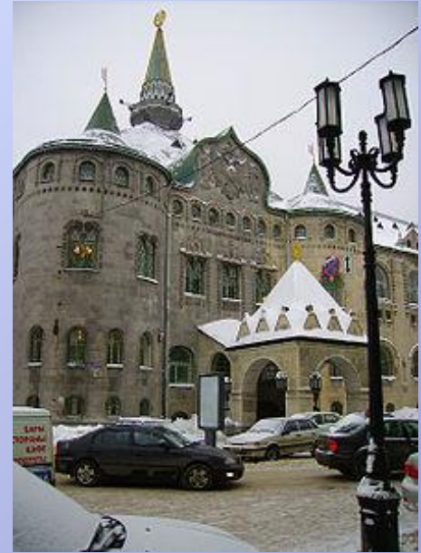
Государственный банк на Большой Покровской улице

В историческом центре города расположен каменный кремль начала XVI века — двухкилометровая кирпичная крепость с 13 сторожевыми башнями. На территории Кремля находится Михайло-Архангельский Собор, построенный в середине XVI века. Так же сохранились многочисленные памятники деревянного зодчества.