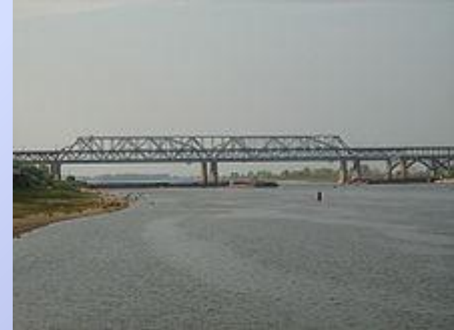
Борский и железнодорожный мост