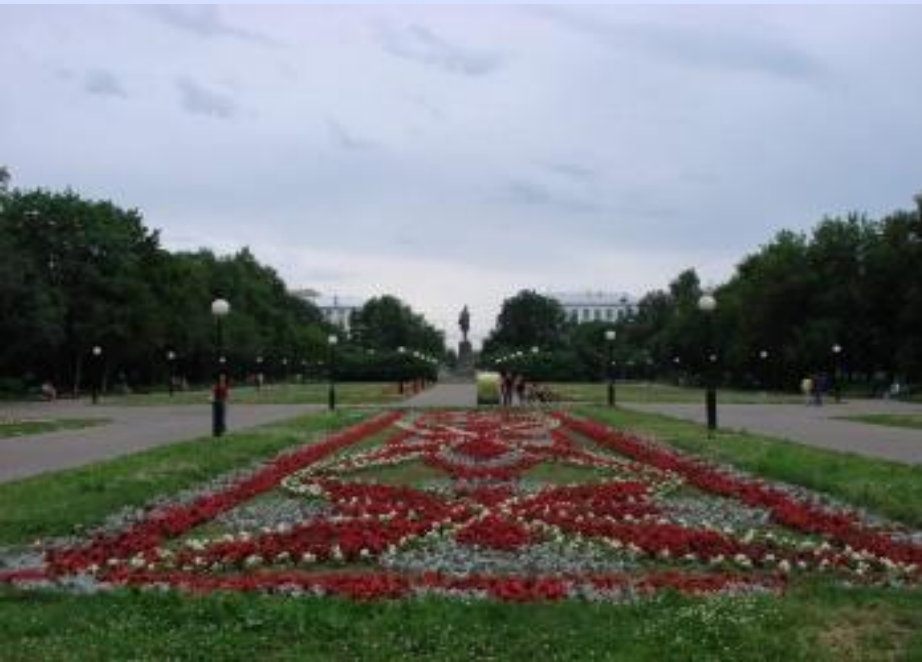
Площадь М. Горького