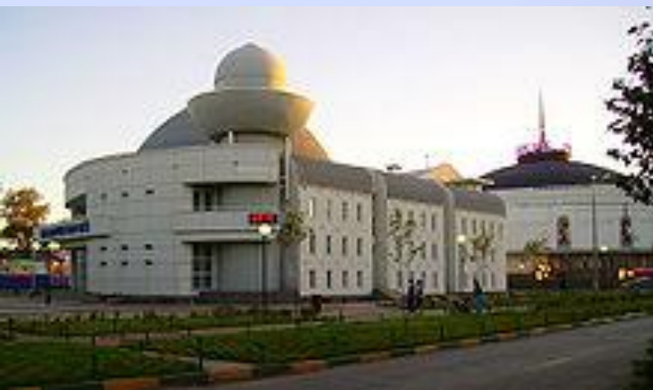
Планетарий и цирк

Всего в Нижнем Новгороде около двух сотен культурных учреждений областного и муниципального значения.