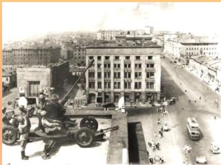
Зенитное орудие на одном из зданий на улице Горького