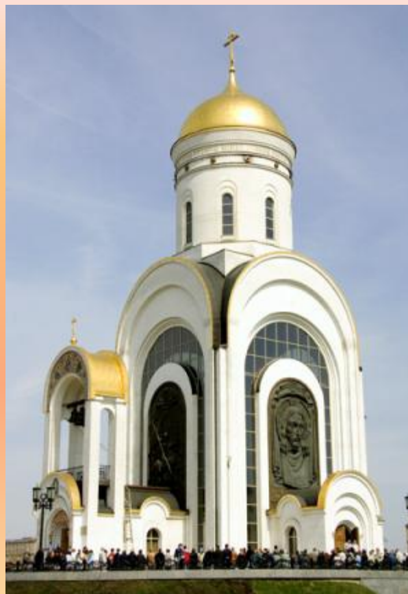
Храм Георгия Победоносца на Поклонной горе