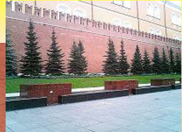
Обелиски городов-героев у Кремлевской стены

«Имя твое неизвестно – подвиг твой бессмертен»