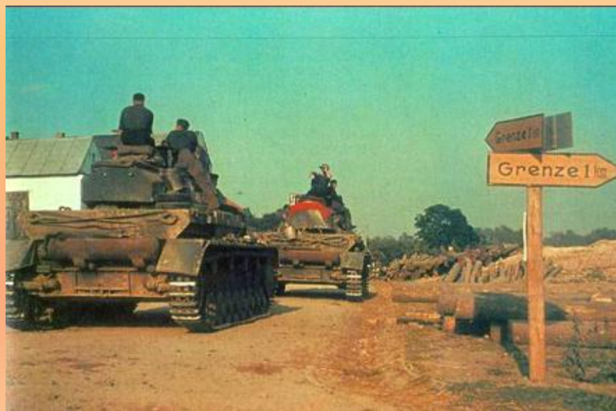
Немецкие танки переходят границу СССР 22 июня 1941 года