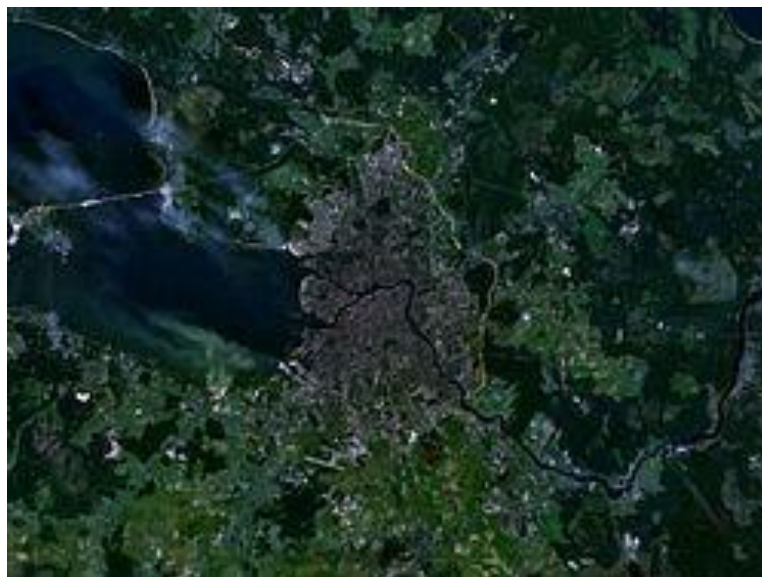
Вид города из космоса, ~ 50 км