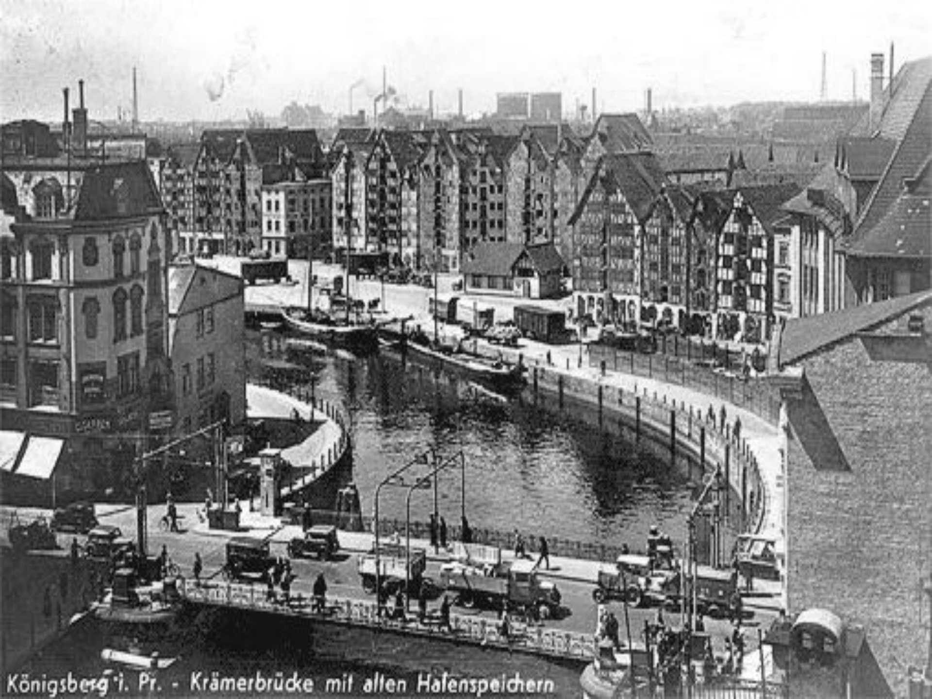
Königsberg i. Pr. - Krämerbrücke mit allen Hafenspeichern