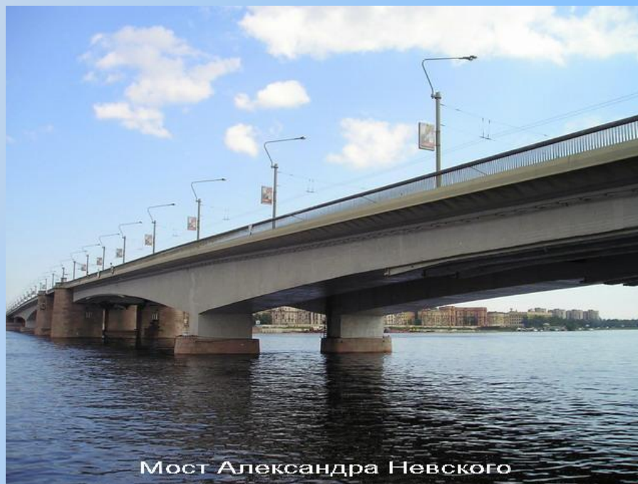
Мост Александра Невского

Мост Александра Невского – мост через Неву. Назван в честь Александра Невского. Соединяет площадь Александра Невского и Заневский проспект. Вплоть до 2004 года (открытие Большого Обуховского (вантового) моста) являлся самым длинным мостом в городе: длина без береговых сооружений 629 м, вместе с пандусами и путепроводами – 905,7 м. Ширина 35 м. Семипролетный, с разводным двукрылым пролетом в центре, железобетонный. Мост построен в 1960-1965 г., испытание моста было проведено с помощью колонны армейских танков.