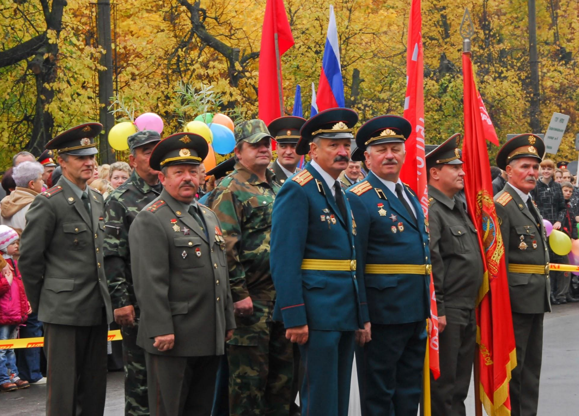
И на золоте погон видим блеск Святого мая. Празднование освобождения Невеля 6 октября.