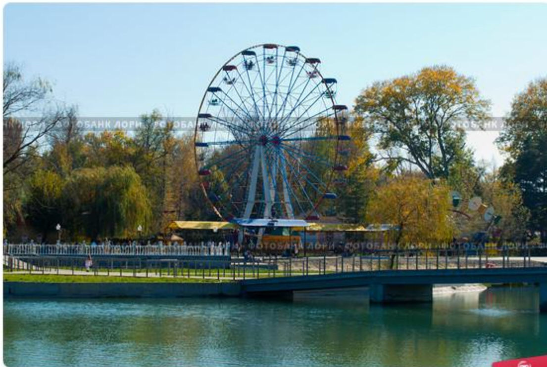
Колесо обозрения в парке отдыха "Зелёный остров". Город Черкесск