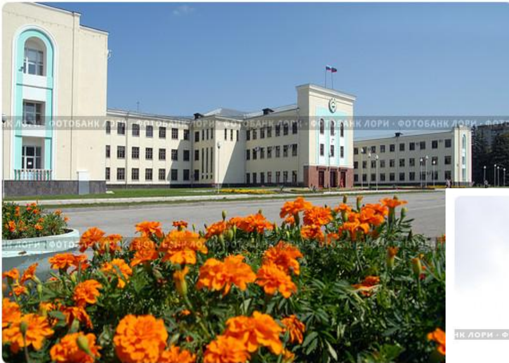
Здание правительства Карачаево-Черкесской республики, г Черкесск

Площадь Ленина, где стоит памятник Ленину и расположен Дом Правительства Карачаево- Черкесской Республики