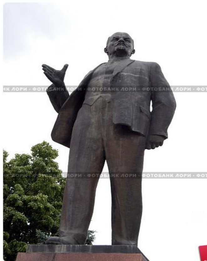
Памятник Ленину в г. Черкесске