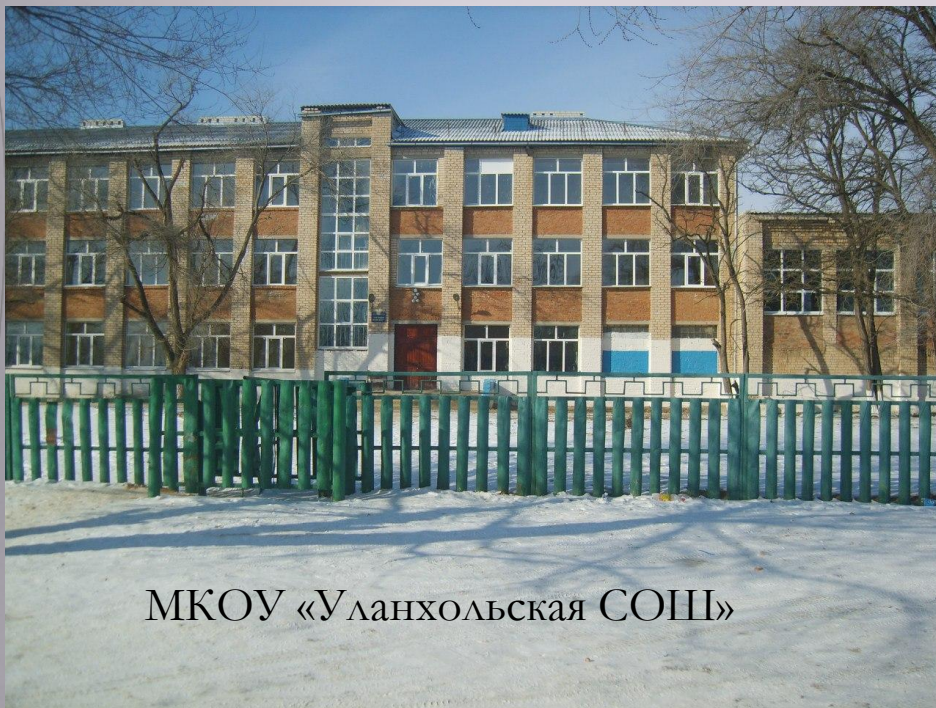
МКОУ «Уланхольская СОШ»

В УЛАНХОЛЬСКОМ СМО ИМЕЮТСЯ СРЕДНЯЯ ШКОЛА, ДЕТСКИЙ САД, ВРАЧЕБНЫЙ ОФИС, ДОМ КУЛЬТУРЫ, СЕЛЬСКАЯ БИБЛИОТЕКА