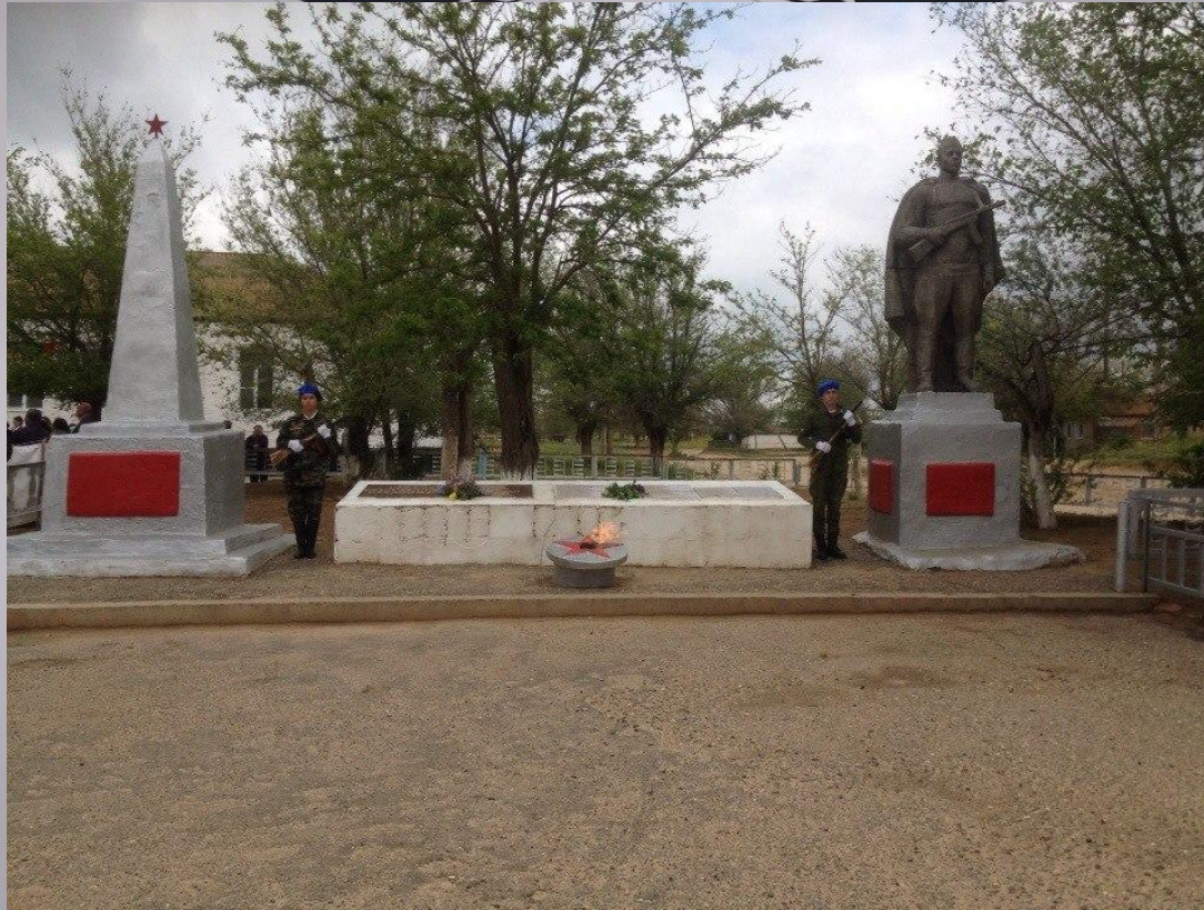
ПАМЯТНИК НЕИЗВЕСТНОМУ СОЛДАТУ