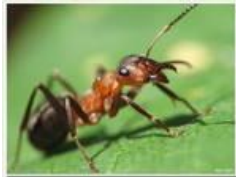
Муравей рыжий лесной ( Formica rufa Linnaeus)

Тело его состоит из подвижно сочлененных между собой отделов – головы, груди, и брюшка. Рассмотрели грудь. Рассмотрев ноги, нашли бедро, голень и лапку. Особи длиной около 7-14 мм, красно-бурого цвета, имеют крупную голову, половину брюшка занимает кислая ядовитая железа, окружённая мощным мускулистым мешком.