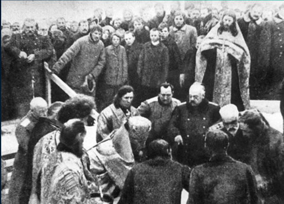
Закладка храма и города Романов-на-Мурмане. 4 октября 1916 г.

4 октября (21 сентября по старому стилю) 1916 года в связи с созданием морского порта в Кольском заливе и строительством Мурманской железной дороги был основан порт Романов-на-Мурмане, получивший с 1917 года статус города и название - Мурманск. Город расположен среди сопок на берегу незамерзающего Кольского залива, в 50 километрах от выхода в Баренцево море. Сегодня Мурманск не только административный центр области, но и самый крупный город мира за Полярным Кругом с населением 330 тыс. жителей.