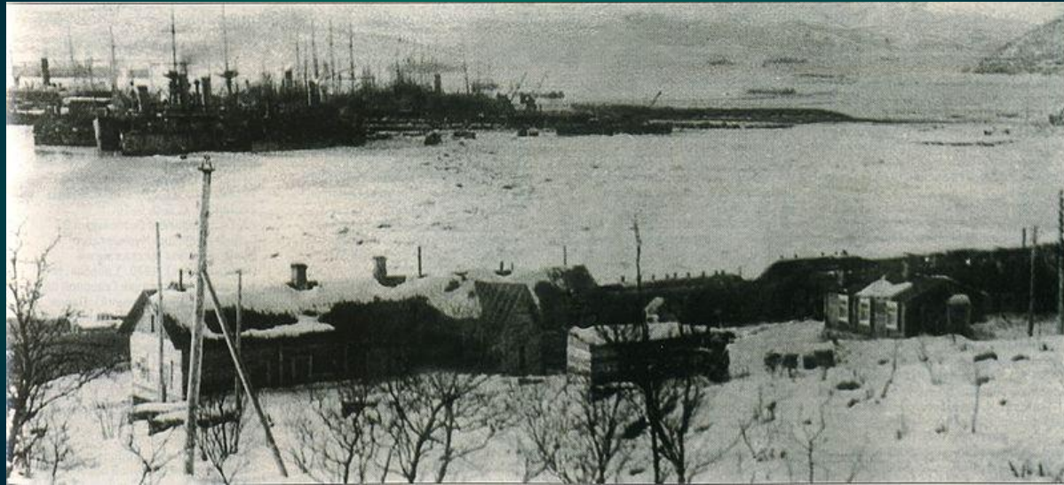
Английская эскадра на Мурманском рейде, 1918 год

В 1917 году в Мурманске был создан временный революционный комитет, во главе которого встали большевики. Но уже в марте 1918 года с военных судов Антанты, которые ещё до февральской революции отдали якоря в Кольском заливе, был высажен на берег вооружённый десант: это стало началом интервенции. В 1919 году власть в городе перешла к белогвардейцам, а Временное правительство Северной области признало верховную власть адмирала Колчака. Осенью 1919 года "союзники" были вынуждены эвакуироваться из Мурманска. 21 февраля 1920 года в городе произошло восстание, организованное большевиками, и власть опять перешла к ним.