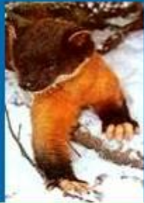
Куница - харза