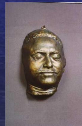
Посмертная маска Петра I