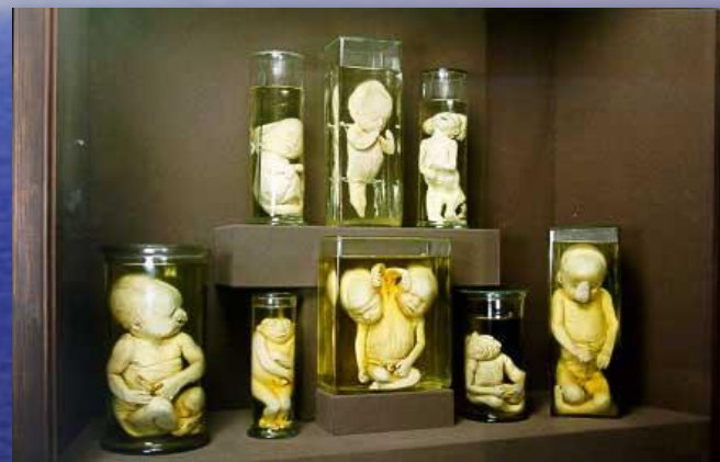
Анатомическая коллекция Рюйша

Этнографический и Анатомический кабинеты в 1879 г. были объединены в Музей антропологии и этнографии им. Петра Великого Российской Академии наук, унаследовавший и само здание Кунсткамеры.