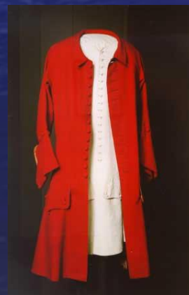
Костюм Петра I