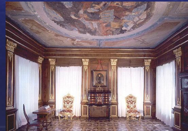
Парадный кабинет А. Меншикова