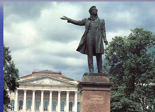
Памятник А.С. Пушкину