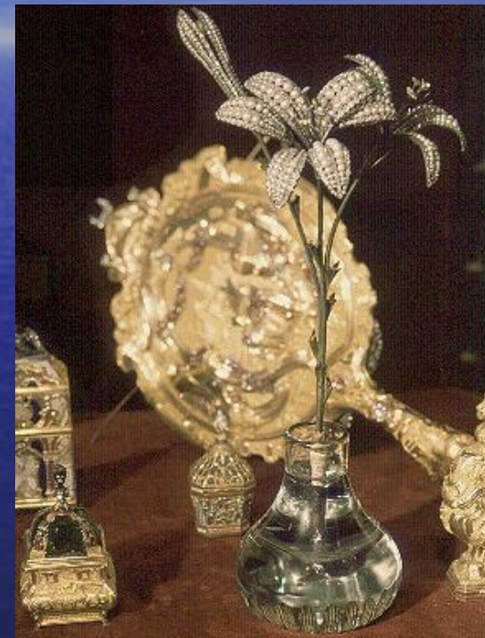
Драгоценности российских императоров

Сегодня это один из крупнейших музеев мира. Художественные коллекции Эрмитажа давно вошедшими в интерьеры бывших жилых и служебных помещений дворца, а интерьеры и убранство дворцовых покоев давно превратились в постоянные музейные экспозиции. Протяженность всех картинных галерей Эрмитажа - более 20 км, в 1988 году Эрмитаж был занесен в книгу рекордов Гиннеса как самая длинная картинная галерея мира.