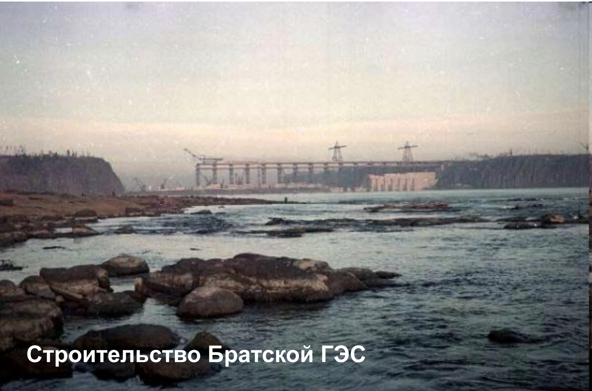
Строительство Братской ГЭС