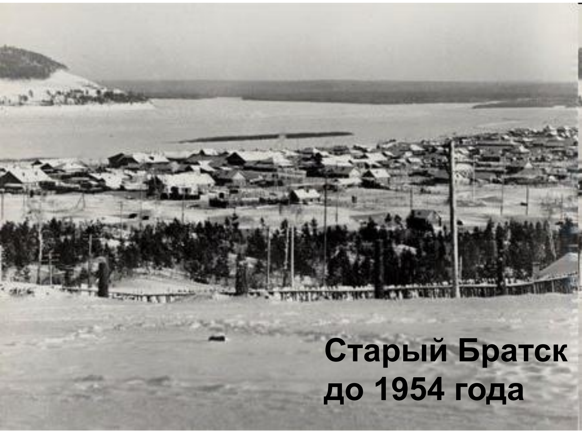
Старый Братск до 1954 года