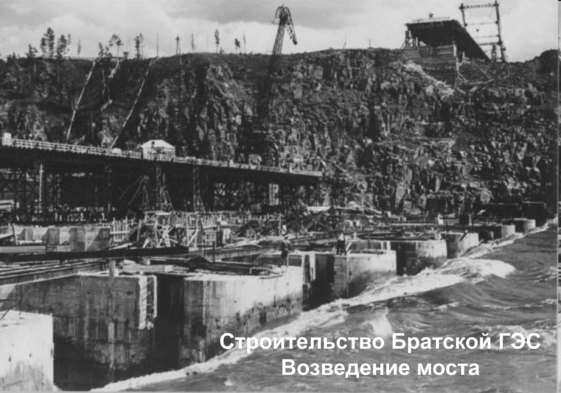
Строительство Братской ГЭС Возведение моста