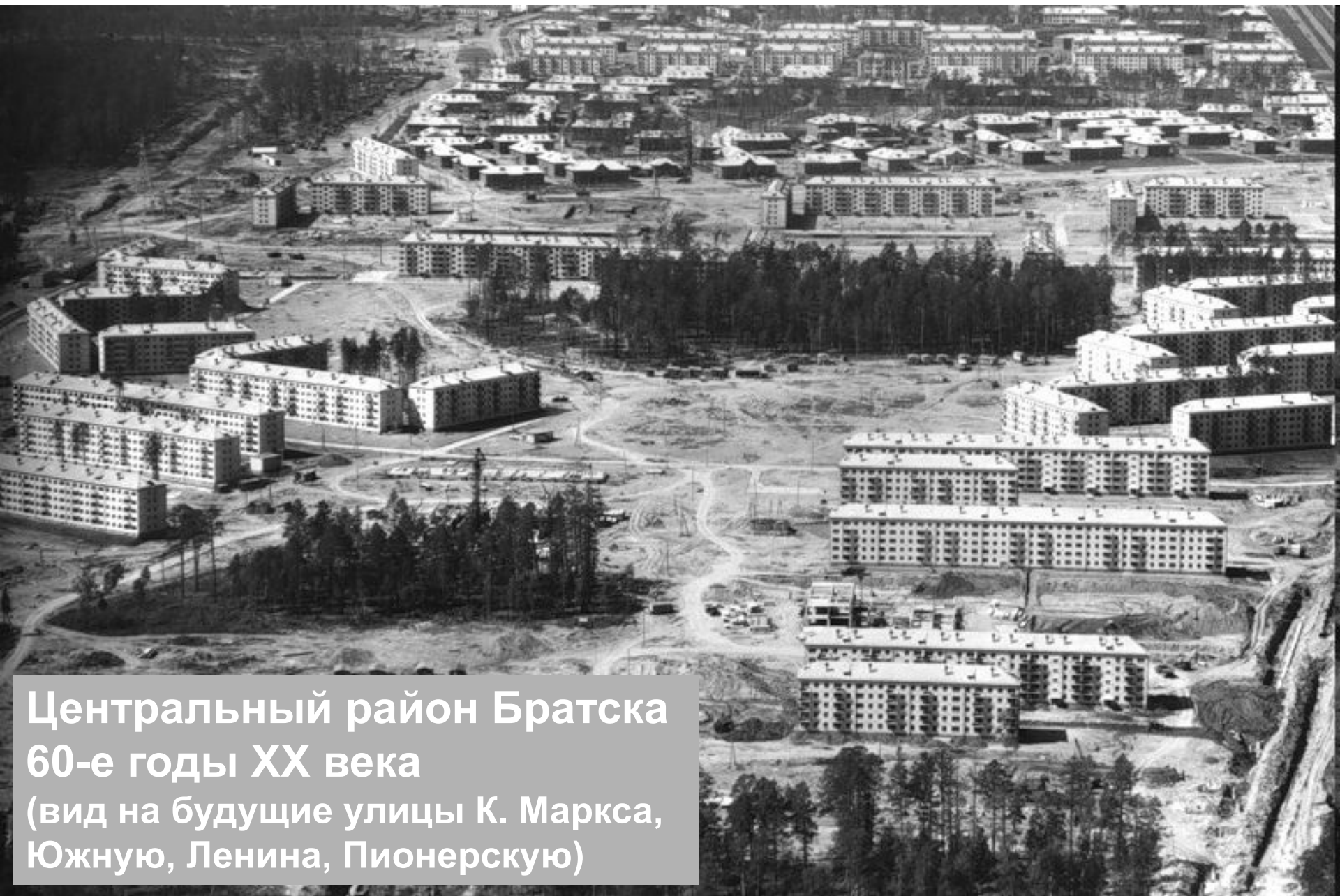
Центральный район Братска 60-е годы XX века (вид на будущие улицы К. Маркса, Южную, Ленина, Пионерскую)