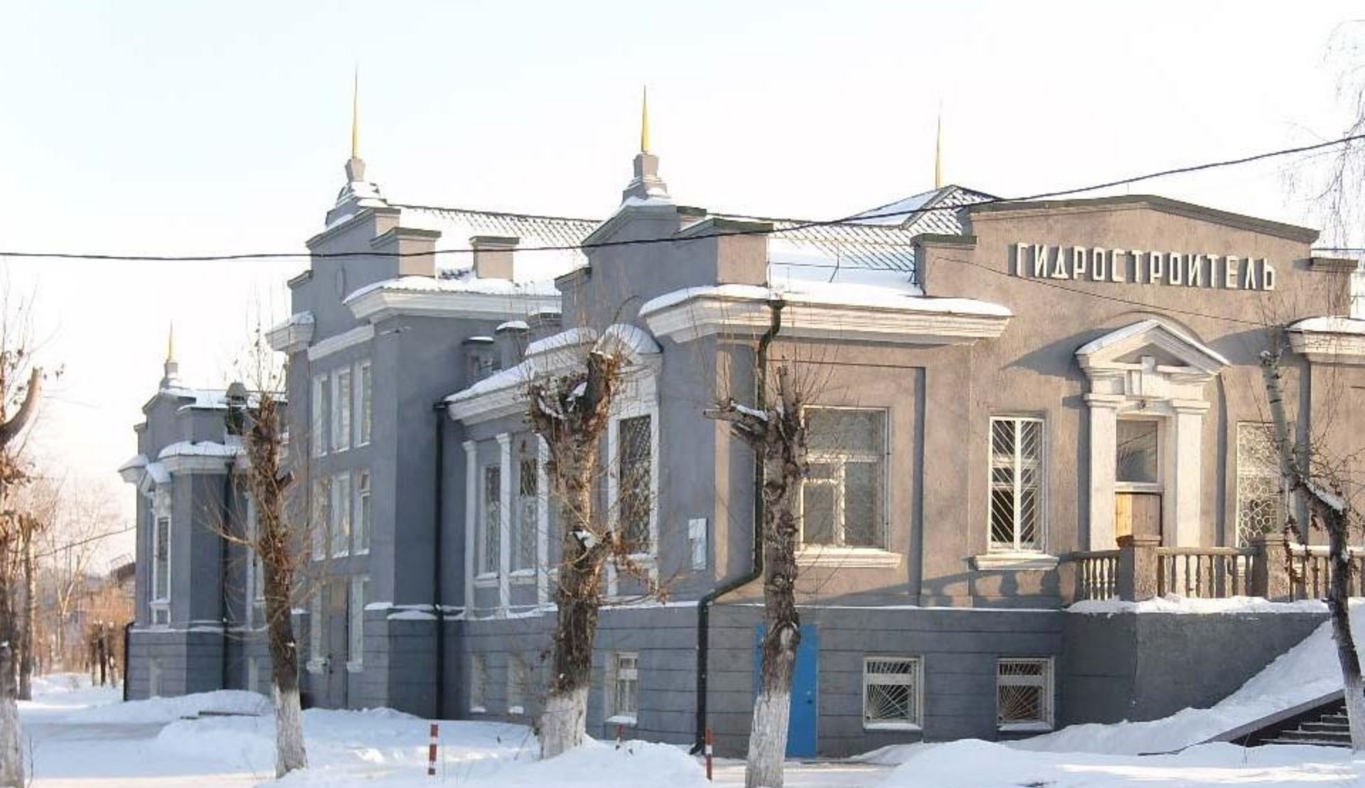
Ж/д вокзал в пос. Осиновка (станция «Гидростроитель»)