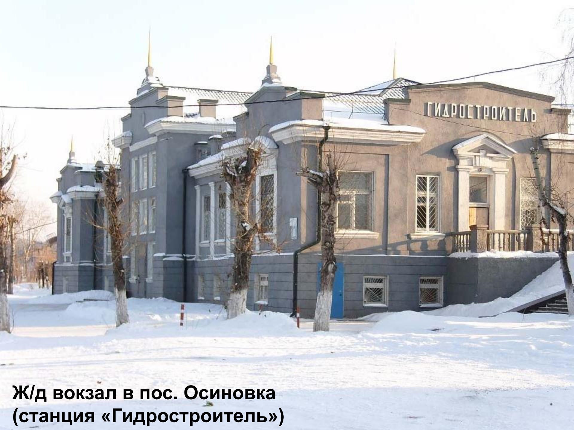
Ж/д вокзал в пос. Осиновка (станция «Гидростроитель»)