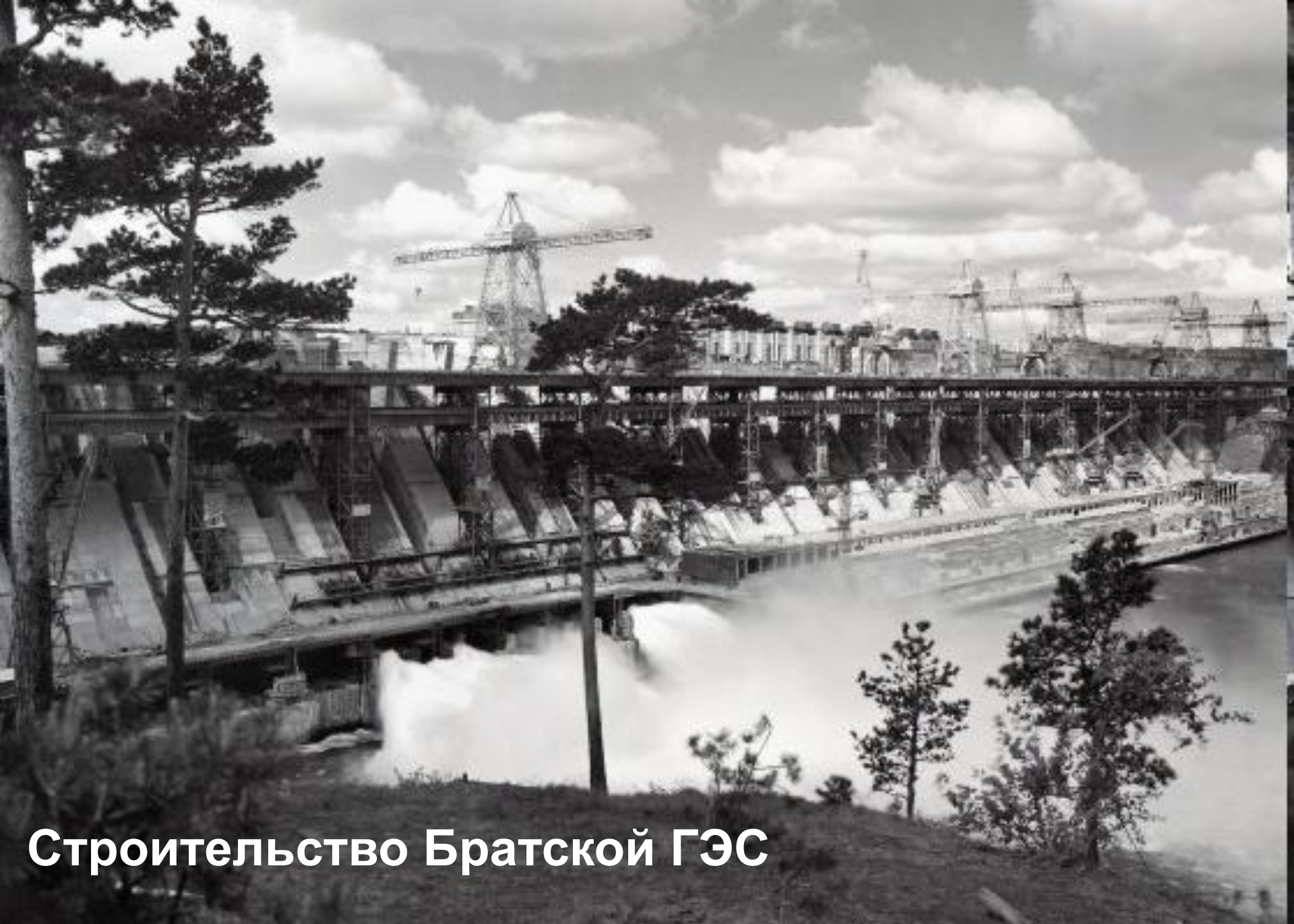
Строительство Братской ГЭС