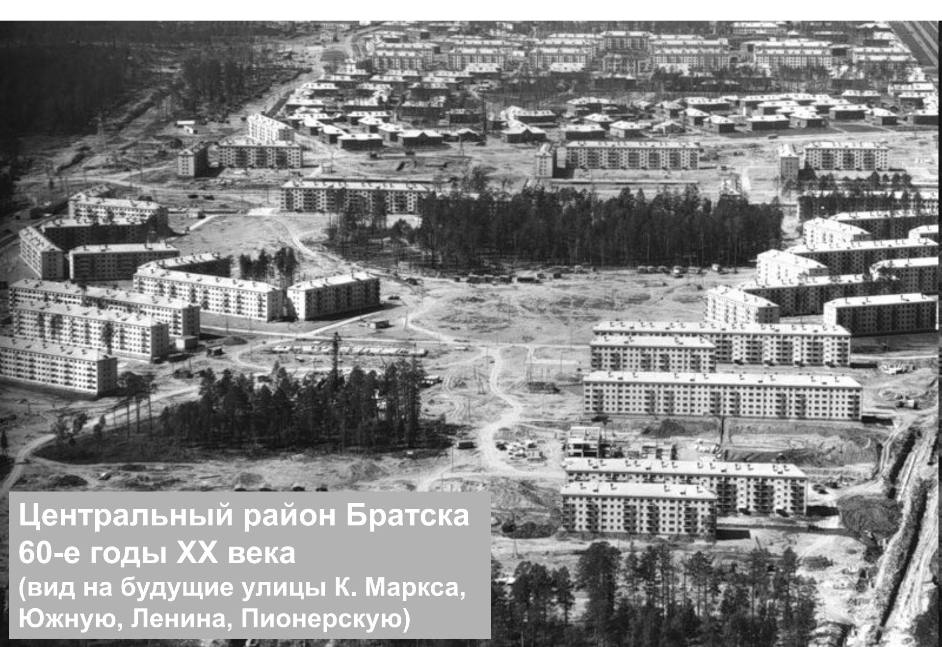
Центральный район Братска 60-е годы XX века (вид на будущие улицы К. Маркса, Южную, Ленина, Пионерскую)