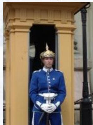
Почётный королевский караул