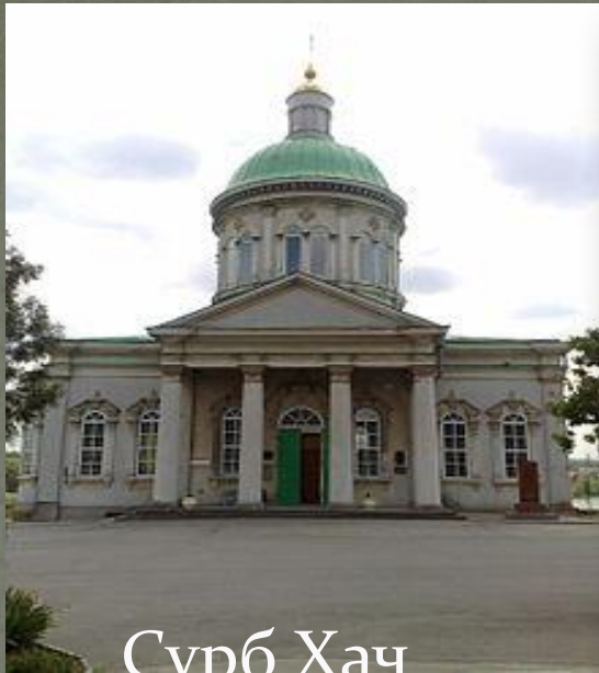
Սուրբ Խաչ Գեորգ