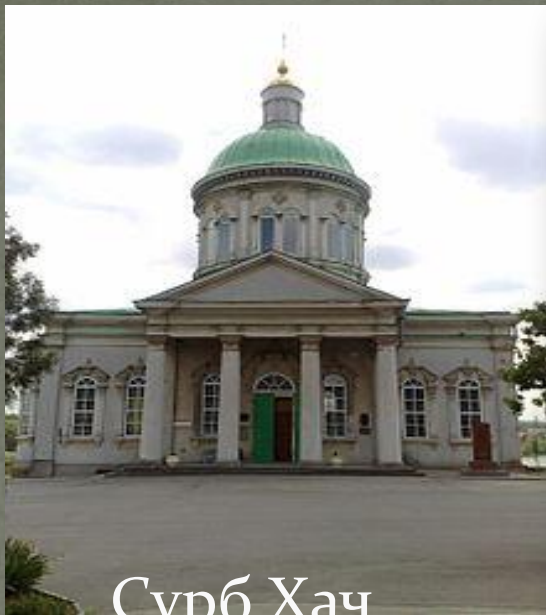
Սուրբ Խաչ Գեորգ