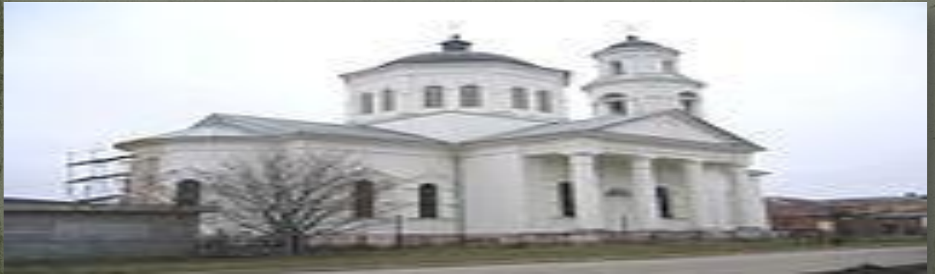
սվ.Ամբարձում ( Կ Չալտըրե )