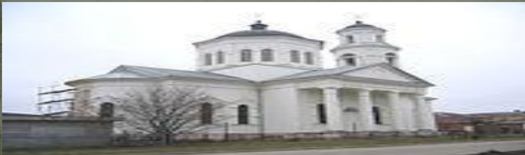
Սուրբ Ամբարձում ( Կալչիկ )