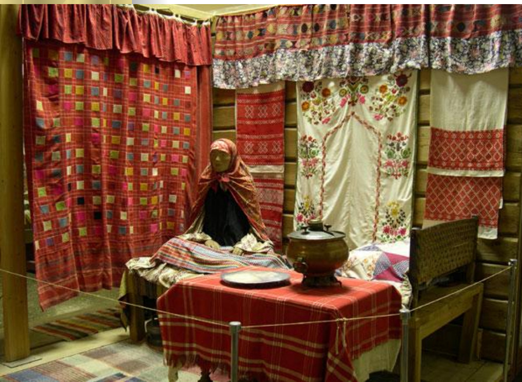
Женская половина дома