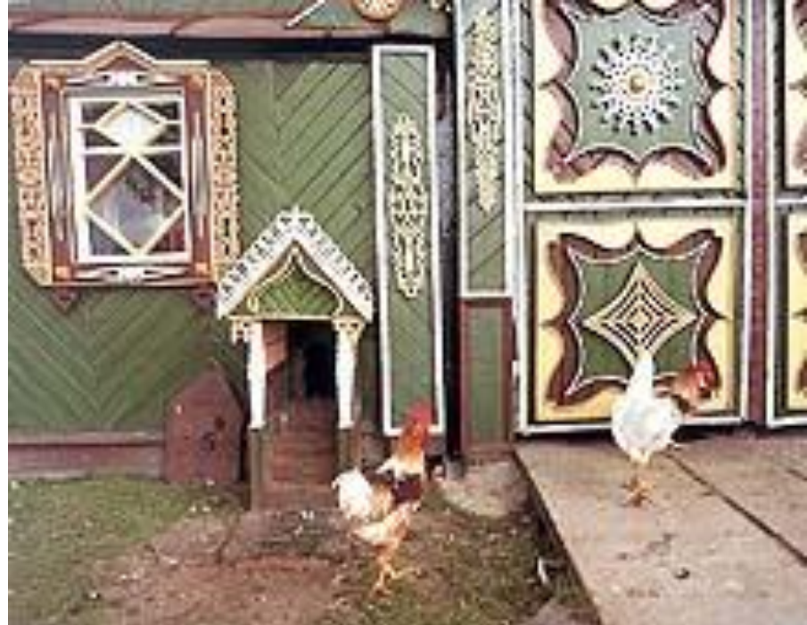
Ворота татарского дома