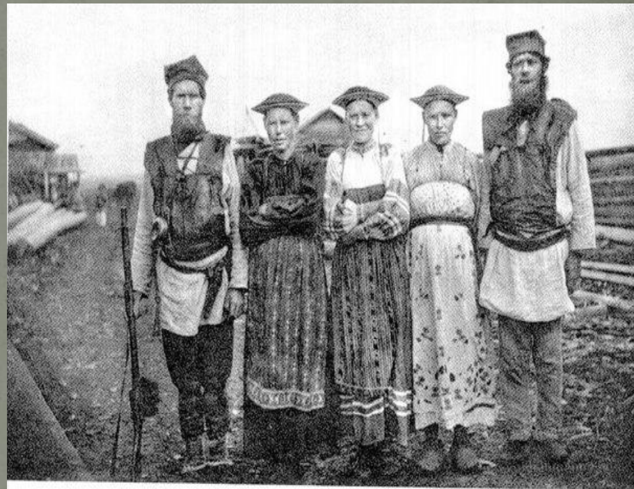
Коми-пермяки д. Лупьинский Мыс. Гайнский район, 1910 г.