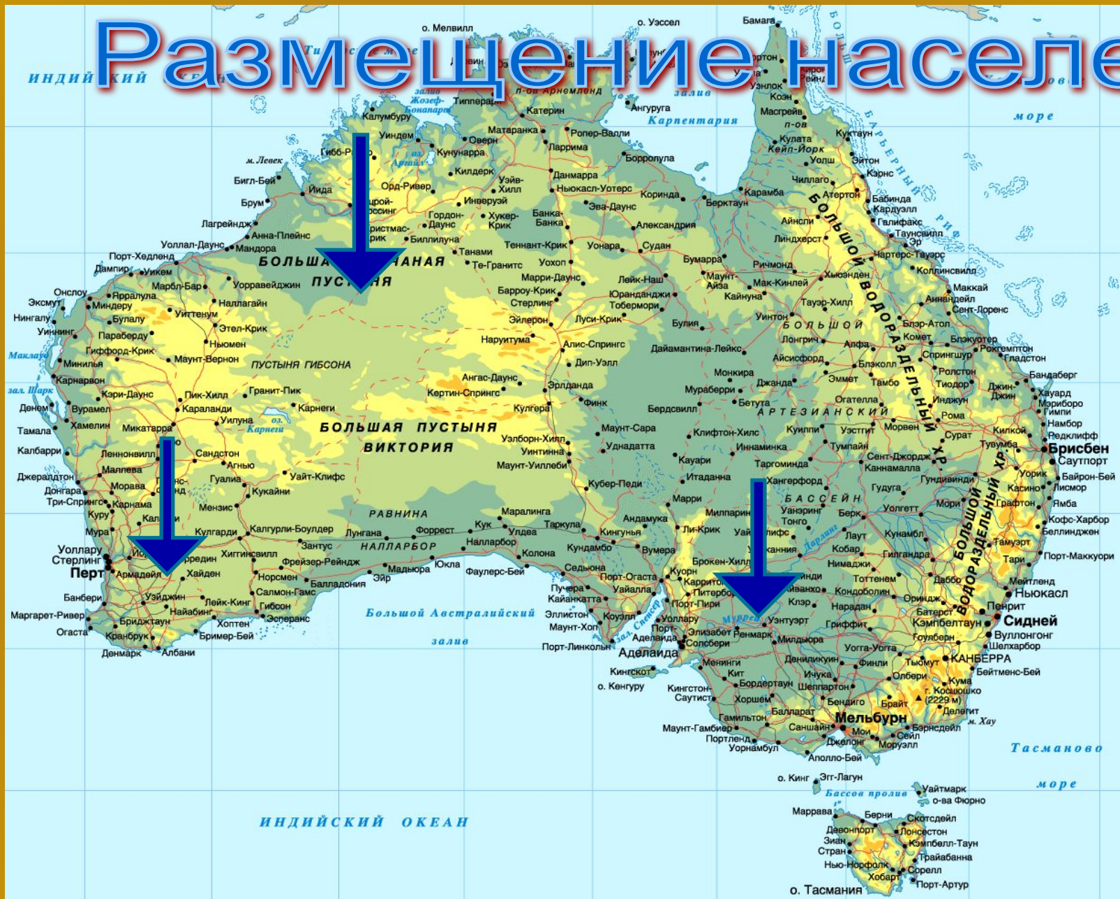
Наиболее плотно и малозаселённые районы Австралии.