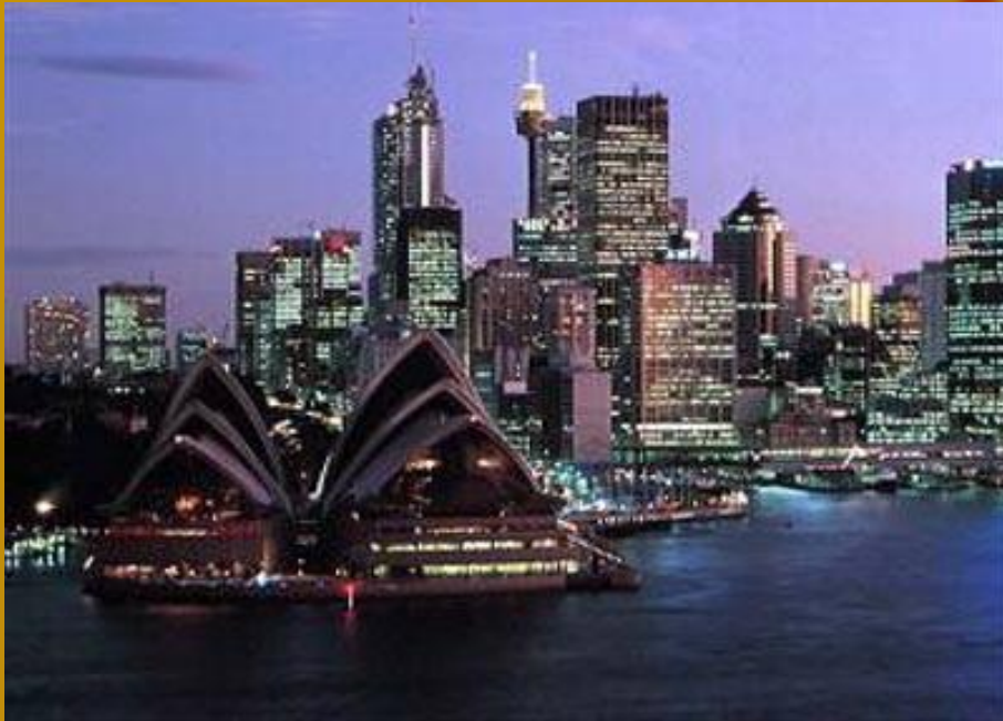
Сиднейский оперный театр