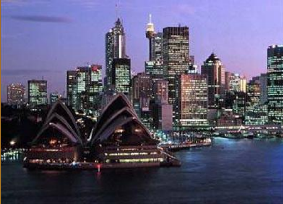
Сиднейский оперный театр