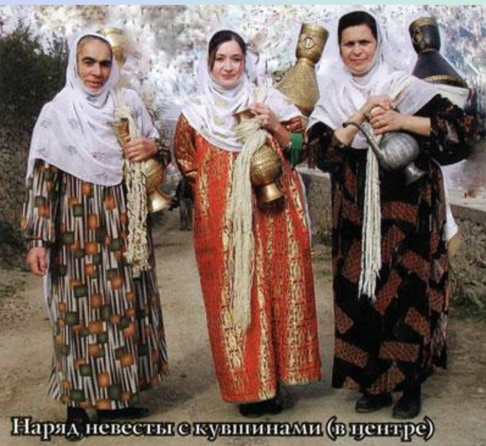
Наряд невесты с кубинами (в центре)