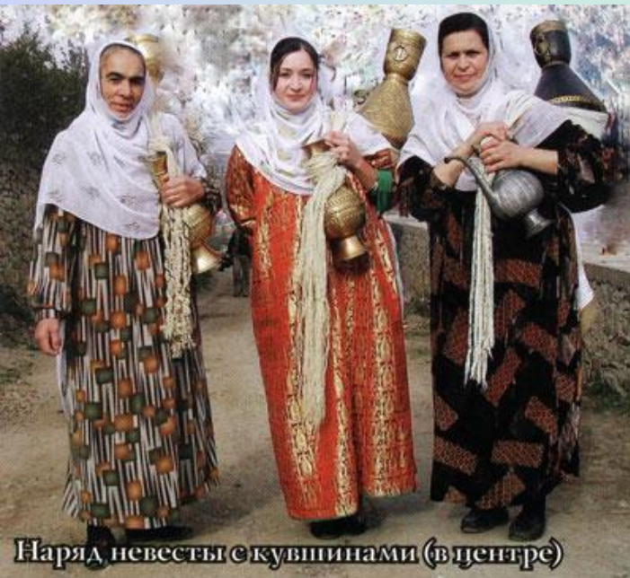
Наряд невесты с кубинами (в центре)