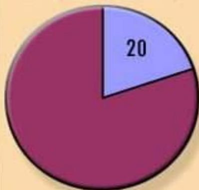
Доля Поволжья в общем производстве авиационных масел, %